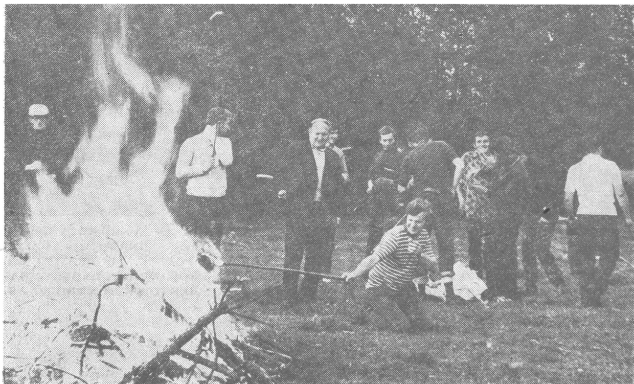
Seminarzyści łądzczy na jednej z wycieczek do pobliskich lasów