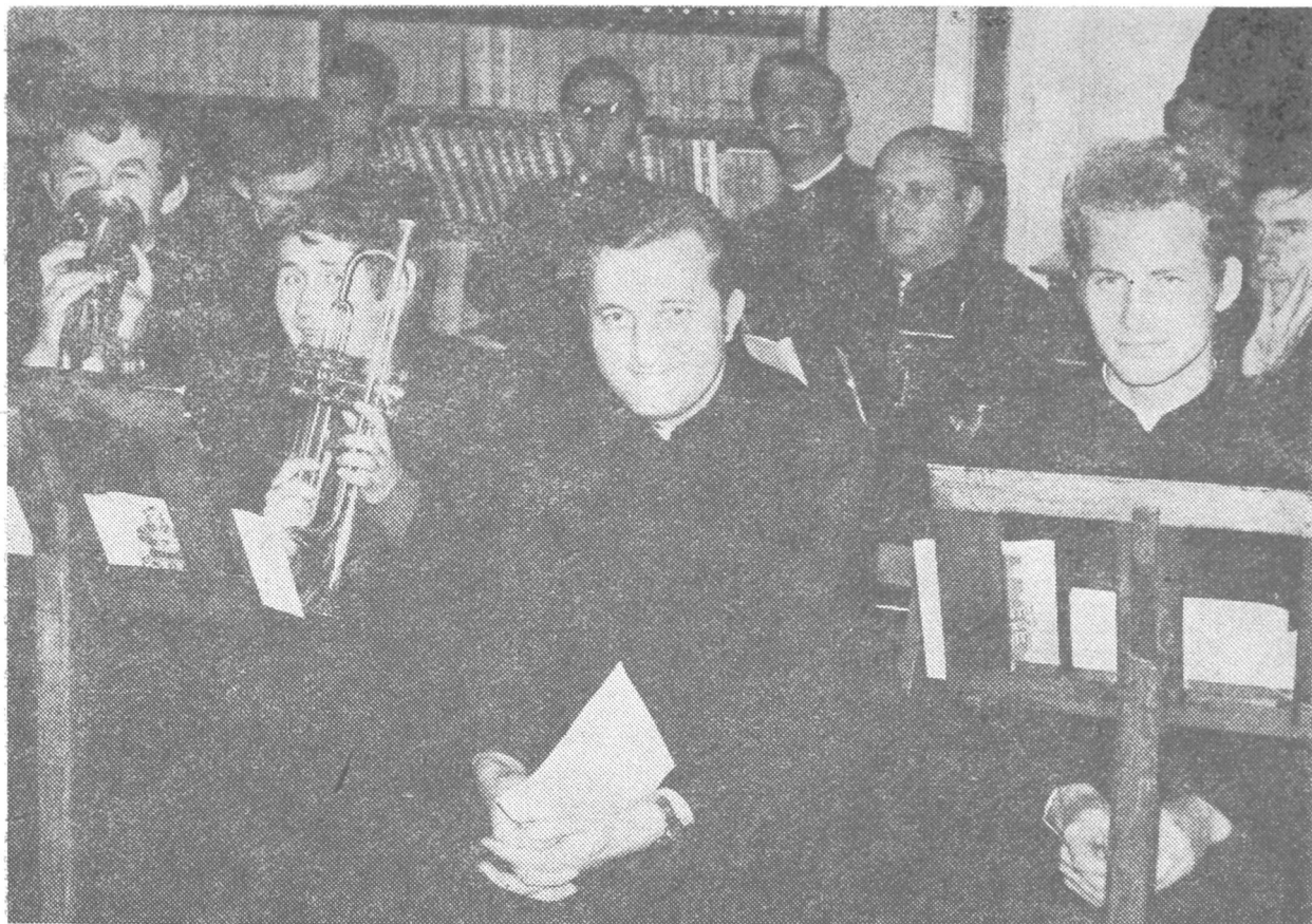
Klerycy i profesorowie łądzczy w przerwie jednej z akademii: część zespołu muzycznego