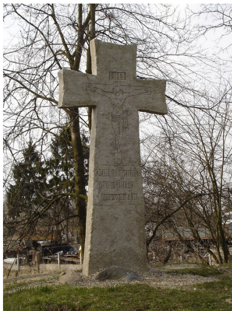
Rys. Krzyŝ kamienny w Stargardzie Szczecińskim 16

Umieszczane na niektórych krzyŝach kamiennych (pokutnych) wyobraŝenia narzędzi dokonanej zbrodni mają najczęściej charakter konturowego rytu wgłębnego.