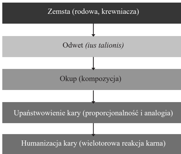
Tablica 1. Ewolucja prawa karnego

J. Makarewicz tłumaczy odejście od zemsty krwawej względami ekonomicznym: „My sądzimy, że ewolucja ta stoi w związku z rozwojem własności prywatnej, wówczas bowiem zjawia się chciwość, jako namiętność równa zemście pod względem siły. Społeczeństwo zachowuje się obojętnie względem tych układów, jakkolwiek w pewnych wypadkach czyni ono zawisłem prawo zemsty od niezapłacenia kary pieniężnej, lub odwrotnie – zakazuje przyjęcia wykupu tam, gdzie zemsta odgrywa rolę surogatu kary. 7 ”