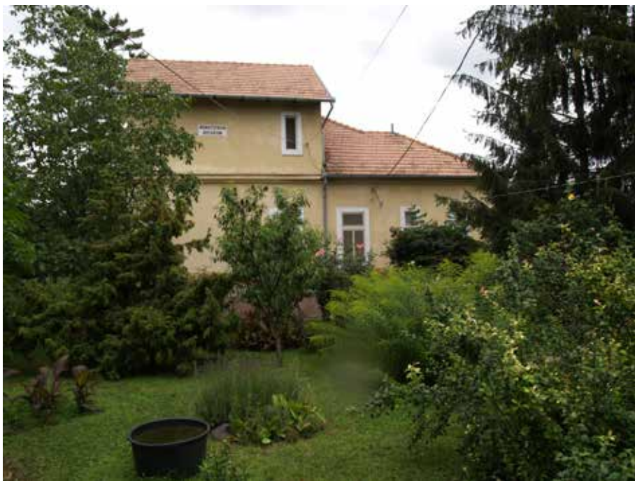
Klasztor w Göd