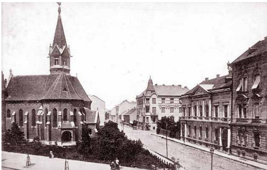
Widok ulicy Madách w Szegedzie