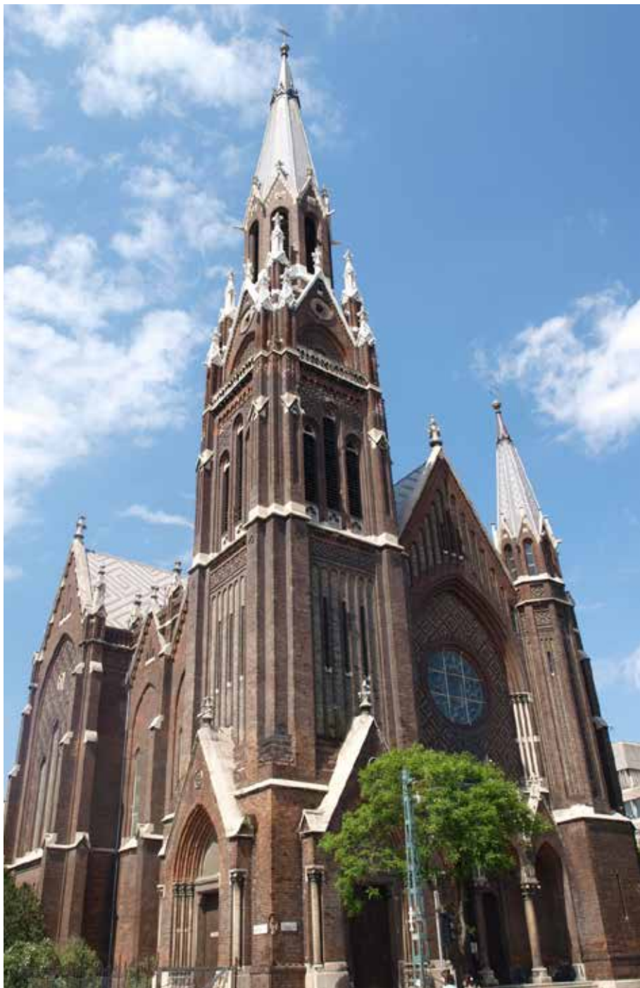
Budapeszt, poddominikański kościół Matki Bożej Różańcowej, gdzie spoczęła w urnie w tamtejszym kolumbarium s. Ilona Szegedy