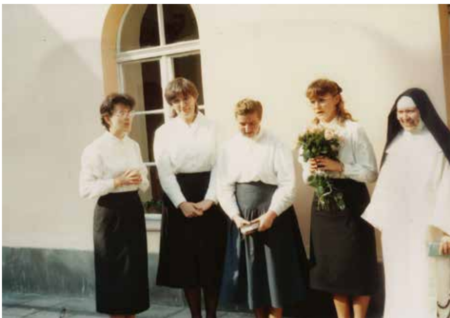
Kandydatki do węgierskich dominikanek w klasztorze dominikanek „Na Gródku” w Krakowie w 1994 r.