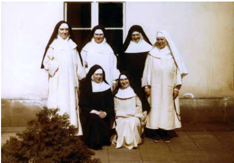
Węgierskie dominikanki na wirydarzu klasztoru dominikanek „Na Gródku” w Krakowie w 1994 r. (pierwsza, druga i czwarta w górnym rzędzie)