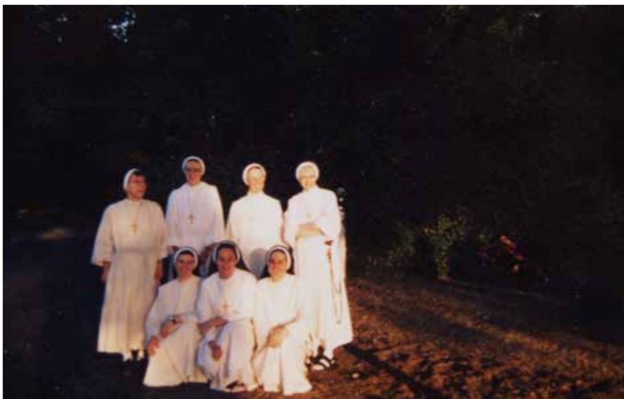
Grupa Węgerek w klasztorze dominikanek w Klausen w Niemczech