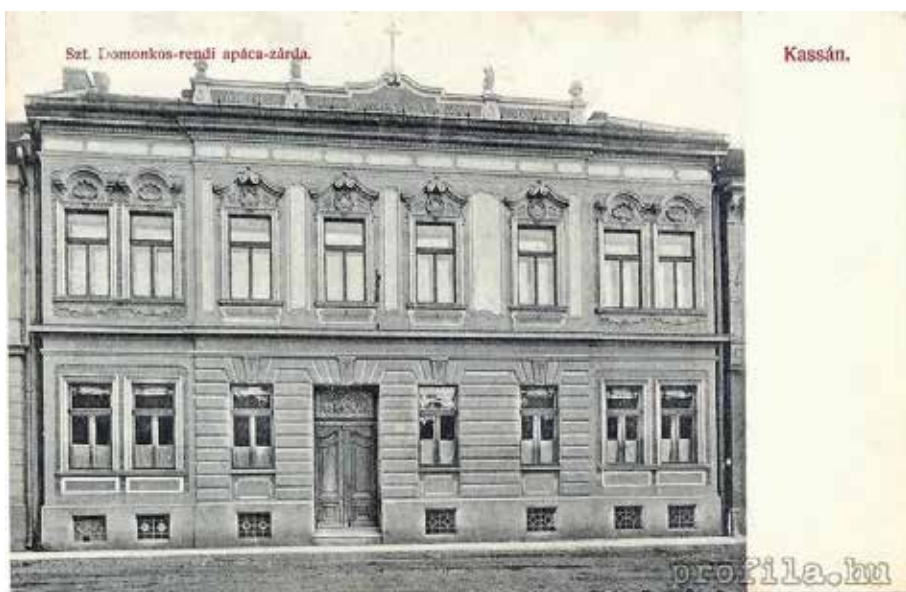
Klasztor dominikanek św. Małgorzaty w Koszycach