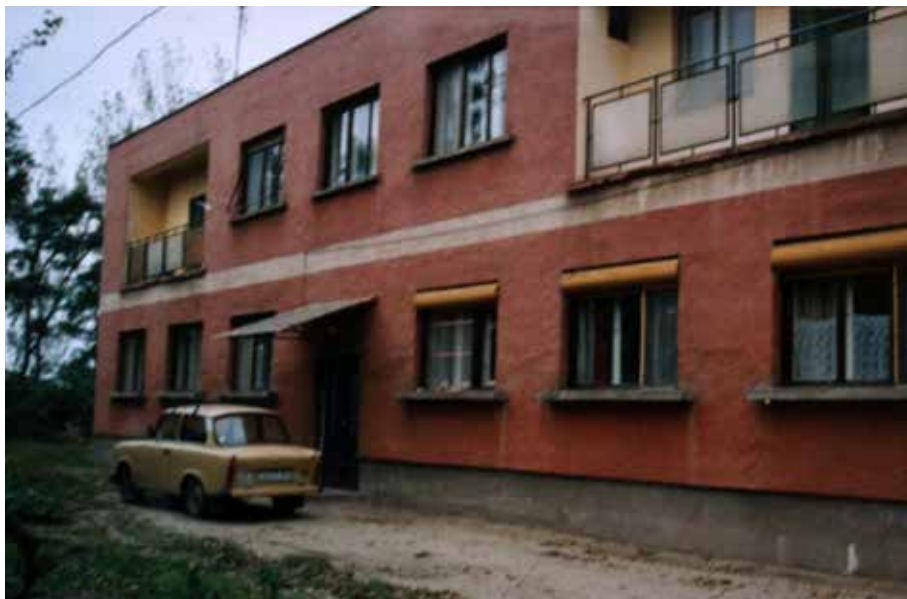
Klasztor w Tápiószentmárton