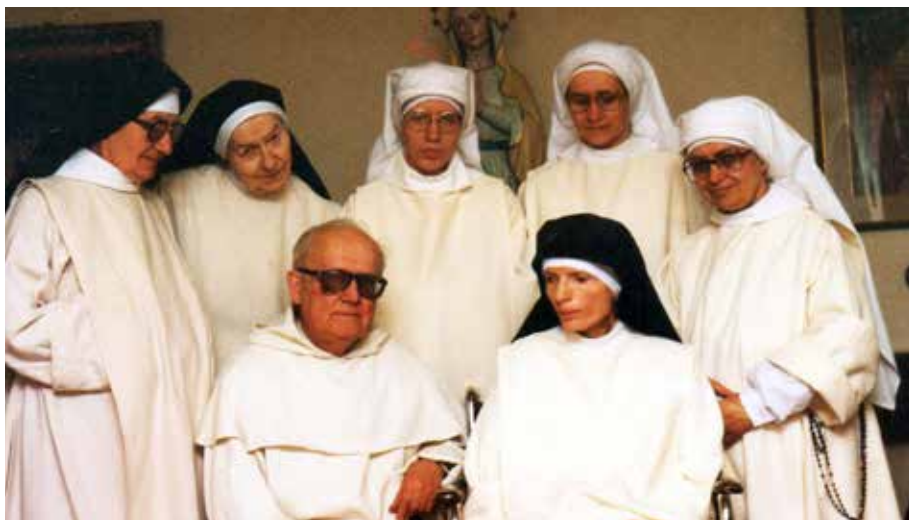
Wspólnota w 1990 r.