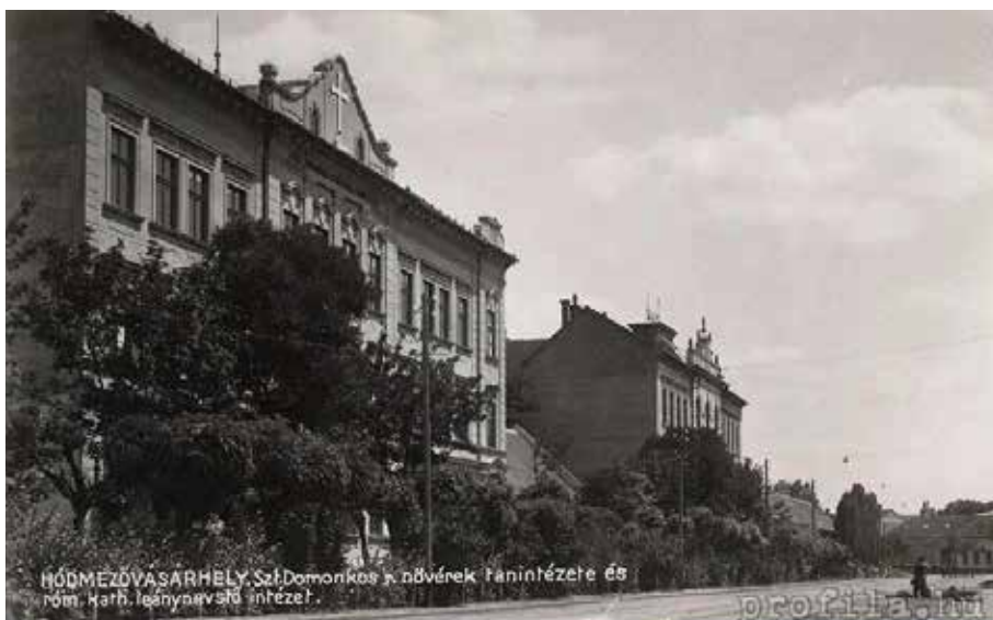
Klasztor dominikanek św. Małgorzaty w Hódmezővásárhely