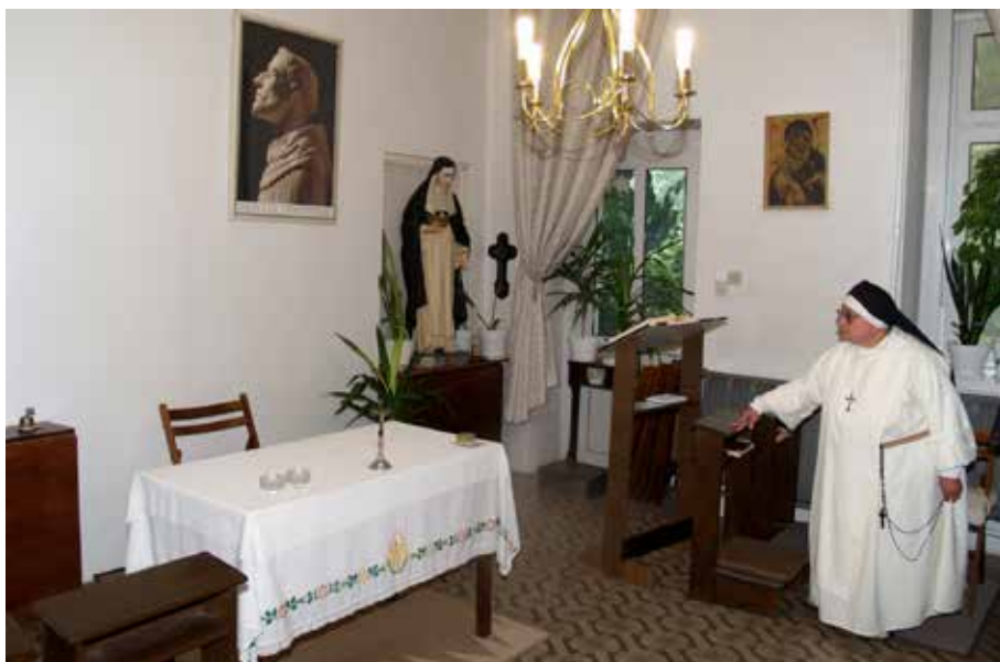
Kaplica klasztoru w Göd