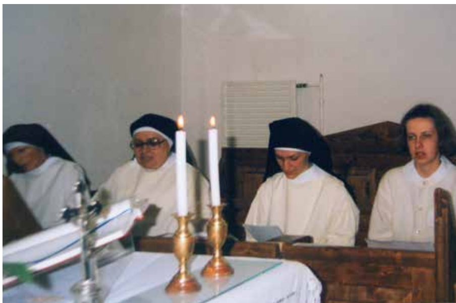
Kaplica klasztorna w w Tápiószentmárton