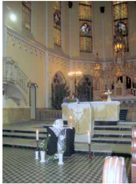
Pogrzeb s. Ilony Szegedy 22 grudnia 2011 r.