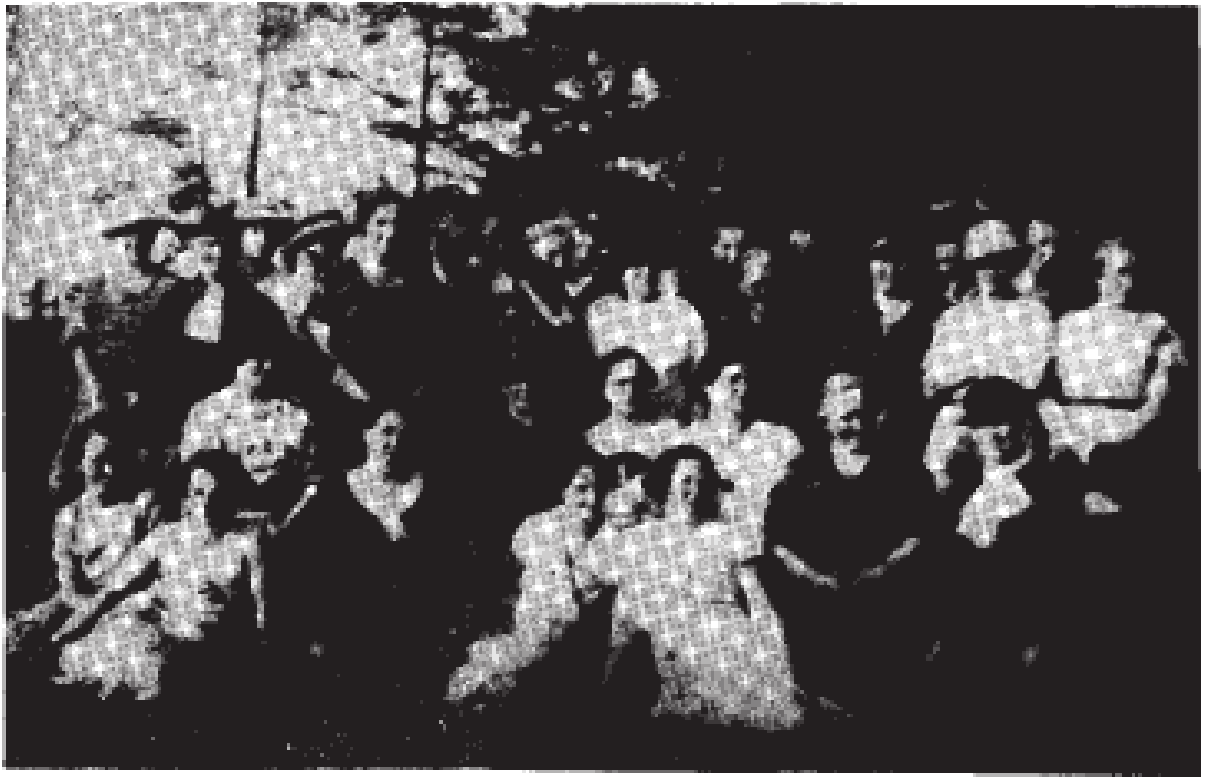
Katolickie Stowarzyszenie Kobiet w Oliwie.