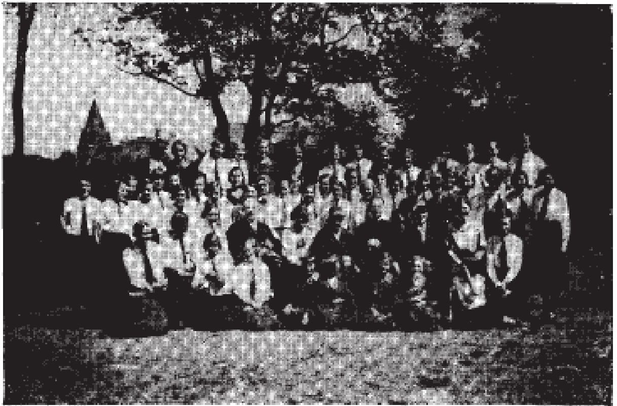
Katolickie Stowarzyszenie Młodzieży Żeńskiej — Gdańsk.