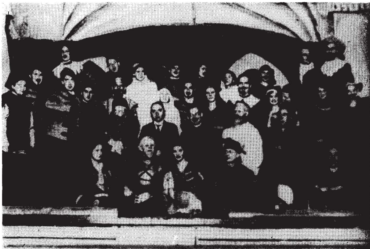
Sodalicja Mariańska Gimnazjum Polskiego i Akademików. „Przeor Paulinów czyli obrona Częstochowy” grana w Werftspeisehaus (sala Stoczni Gdańskiej) 1932/33.