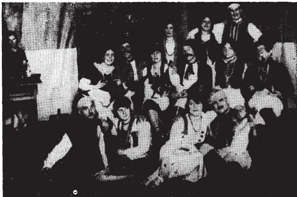
Operetka „Wiesława” odegrana przez Towarzystwo Śpiewacze „Św. Cecylii” Gdańsk-Wrzeszcz 6 listopada 1927 r.