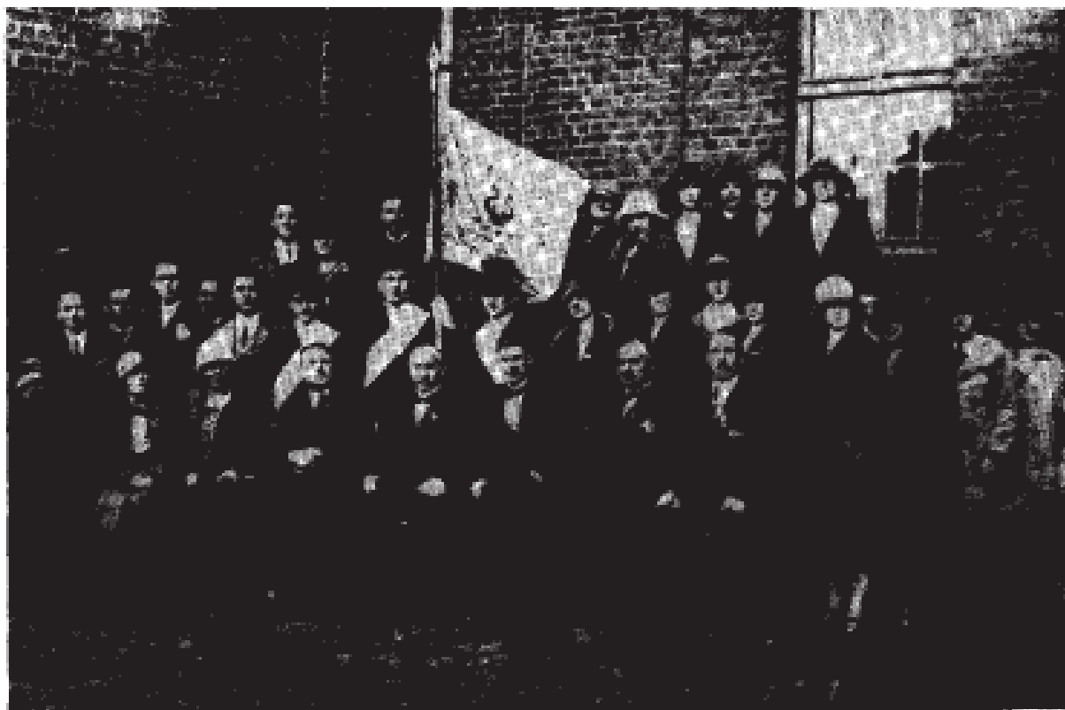
Poświęcenie sztandaru Towarzystwa Śpiewaczego „Św. Cecylii”, Gdańsk-Wrzeszcz 10 października 1926 w kościele Św. Stanisława.