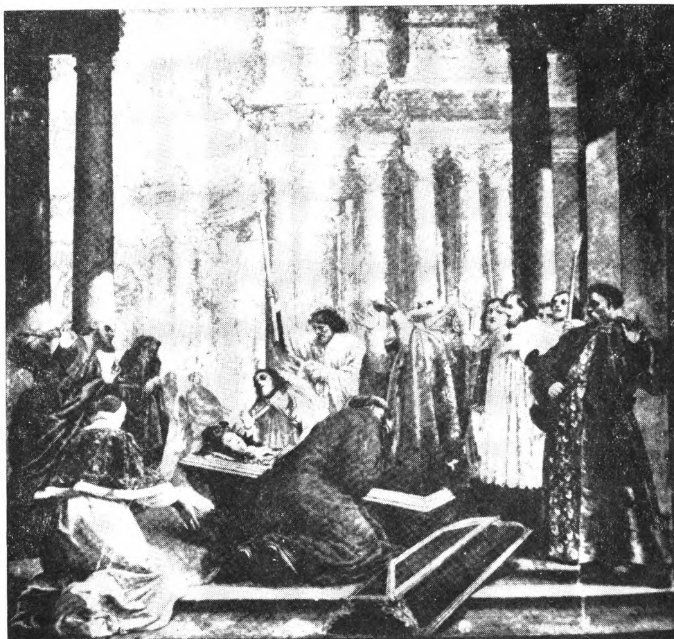
11. obok: „Komunia Jagiellonów”, obraz sprzed 1642 r. w klasztorze Paulinów na Jasnej Górze w Częstochowie.