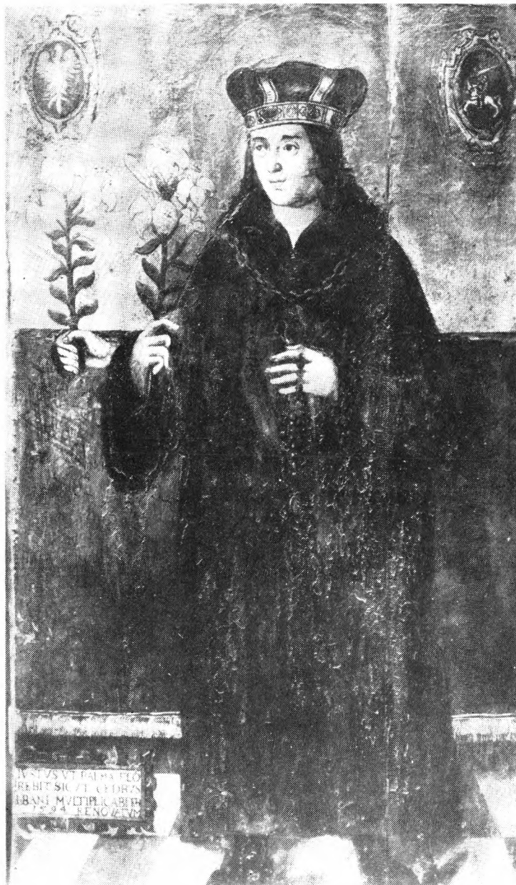
3. Sw. Kazimierz, obraz z 1 poł. XVI w. w katedrze w Wilnie.