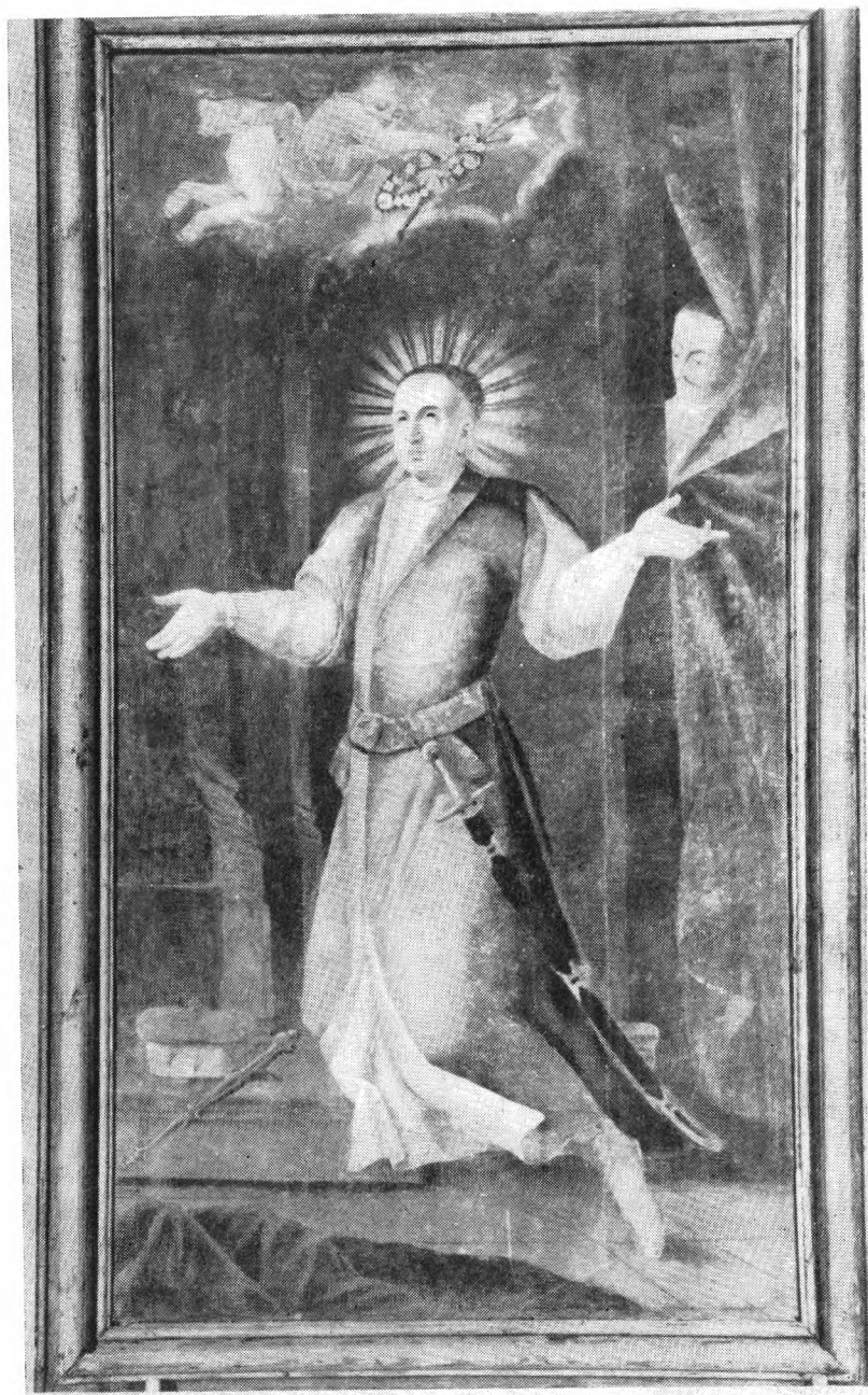
9. Św. Kazimierz, obraz z 1769 r. w kościele parafialnym w Kijach. Kazimierz Mołodziński.