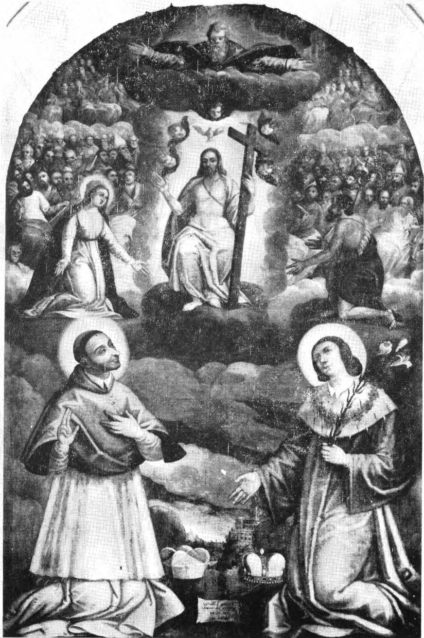
6. Obraz z przedstawieniem śś. Karola Boromeusza (?) i Kazimierza z 1615 r. w ołtarzu bocznym kościoła Bożego Ciała w Krakowie. Astolf Vagioli. Fot. J. Langda.