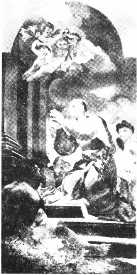
8. ryc. prawa: Sw. Kazimierz, obraz sprzed 1750 r. w katedrze na Wawelu. Tadeusz Kuntze (Konicz). Wg Sztuka sakralna w Polsce .