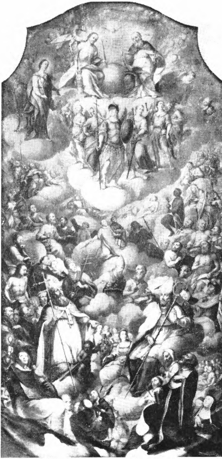
7. ryc. lewa: Wszyscy Święci, obraz z 1763 r. w kościele śś. Piotra i Pawła w Krakowie. Łukasz Orłowski. Fot. W. Wolny