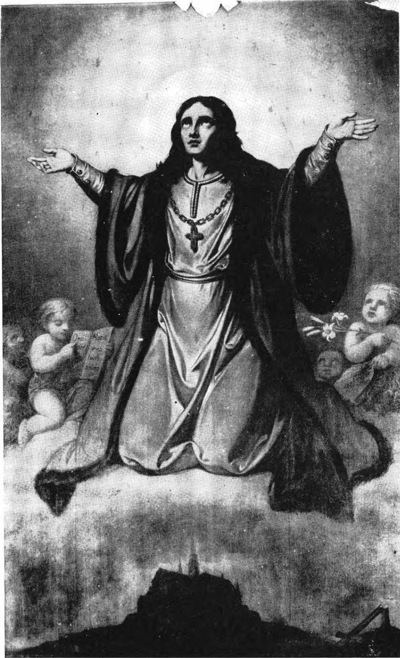
10. Św. Kazimierz, obraz z 1868 r. w ołtarzu bocznym kościoła Misjonarzy pw. Nawrócenia św. Pawła na Stradomiu w Krakowie Wojciech Eliaż.