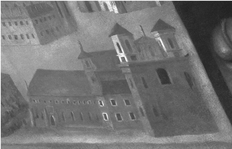
3. Widok klasztoru i kościoła w Łądzie w 1714 r., fragment obrazu Adama Swacha Alegoria rozwoju zakonu cystersów....