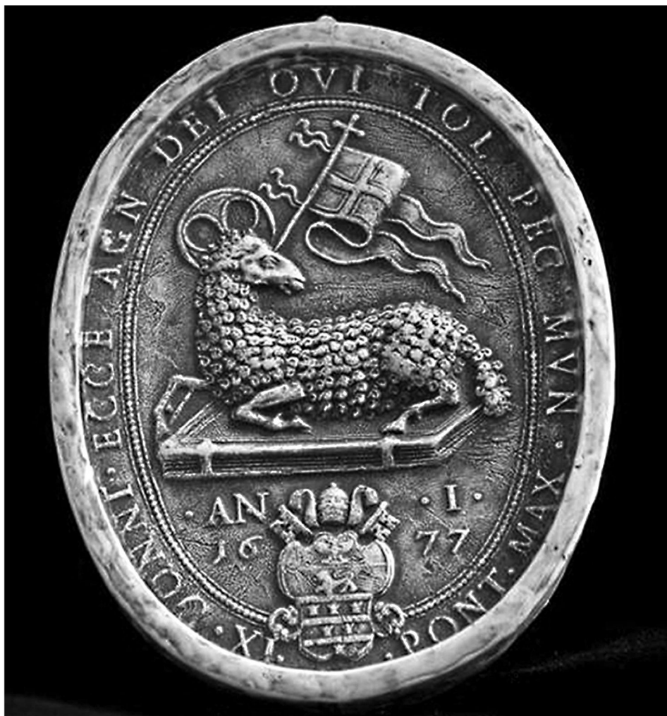
8. Replika medalionu Agnus Dei Innocentego XI z pierwszej edycji w pierwszym roku pontyfikatu 1677 r.