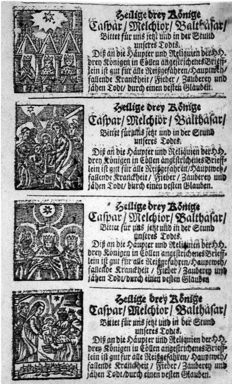
7. Karta zadrukowana czterema egzemplarzami Dreikönigszettel z niemiecką wersją tekstu, 15,5×9,5 cm, Kolonia XVIII w.