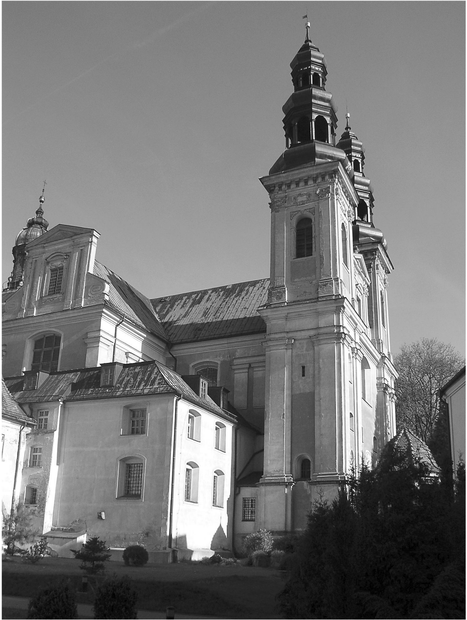
4. Wschodnia partia kościoła w Łądzie z widokiem na wieżę. Fot. autor 2009 r.