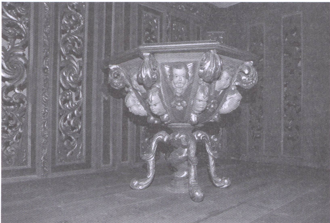
Fot. 2. Puck. Fara pw. śś Ap. Piotra i Pawła. Chrzcielnica w baptysterium. 4 ćw. XVII w.

na wielobocznym postumencie, dopełnionym bocznymi trójschodkowymi: wejściem i wyjściem, ma konstrukcję filungową. Narożniki wyznaczają pary kręconych kolumn. Ścianki dwudzielne, wypełnione są ażurowym motywem bujnych liści akantu; dwuskrzydłowe drzwi kompozycyjnie rozwiązane zostały jak pozostałe boki. Gzyms, gierowany w narożnikach nad kolumnami, zdobią motywy akantowe. Zwieńczenie parawanowych ścian dopełniają ażurowe motywy roślinno-wolutowe; w narożnikach ustawiono alegoryczne figury niewiast. Jedna z kobiet tuli troje dzieci — to personifikacja Caritas . Pozostałe postaci mogą uosabiać cnoty chrześcijańskie: wiarę, nadzieję i męstwo, ale brak im atrybutów.