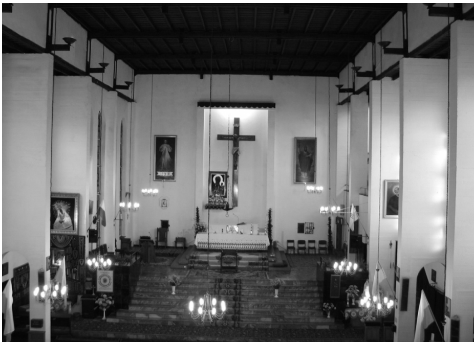
Wnętrze kaplicy pw. św. Brunona w Giżycku dzisiaj

Dziś obraz św. Brunona zawieszony jest po prawej stronie ściany ołtarzowej, na wysokości ok. 2 metrów. Samo płótno ma wymiary 300 cm x 150 cm, wykonano go techniką olejną 3 . Obecnie obramowane jest złotą ramą – co sprawia, że odcina się na tle białej ściany i jest widoczny z każdego miejsca w kościele 4 . W lewym dolnym rogu widnieje podpis autora – Julian Wałdowski, oraz data, w którym powstało płótno – 1912 r.