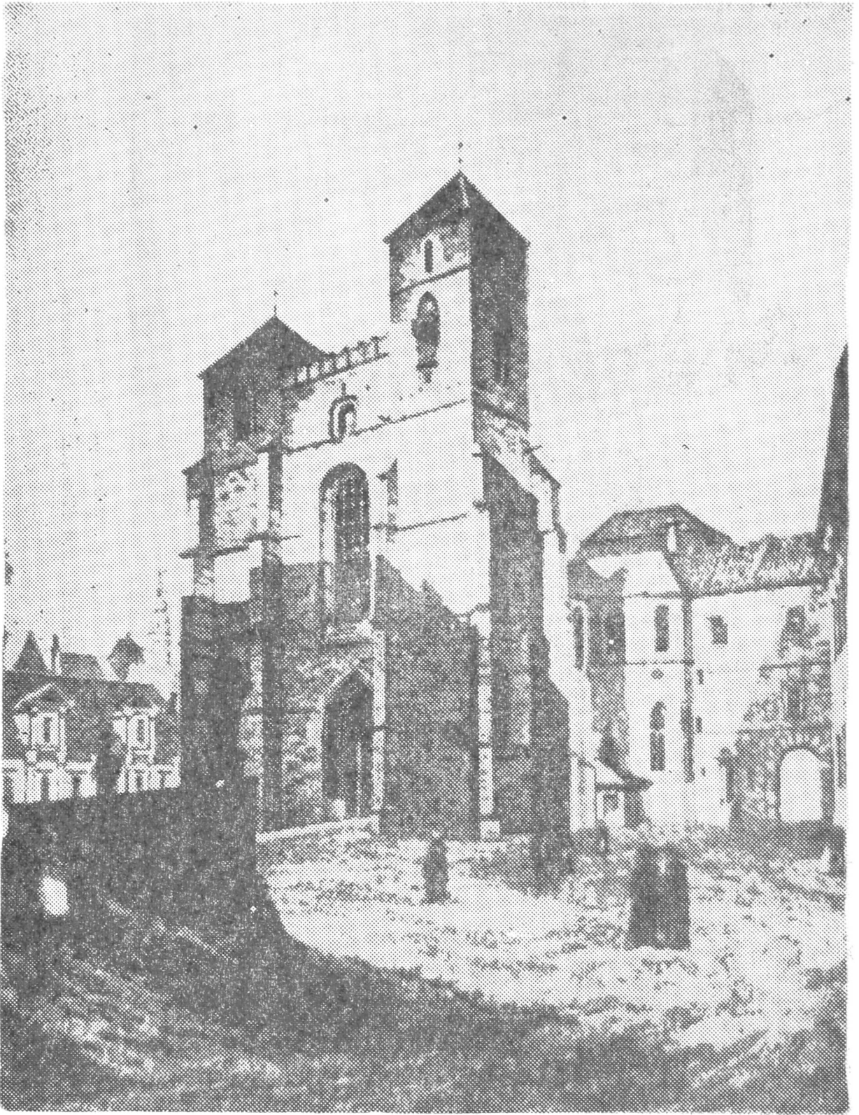
Kościół NMP w Kłodzku wzniesiony przez joannitów w XV w. (wg G. Grundmann, Dome, Kirche und Kloster in Schlesien)