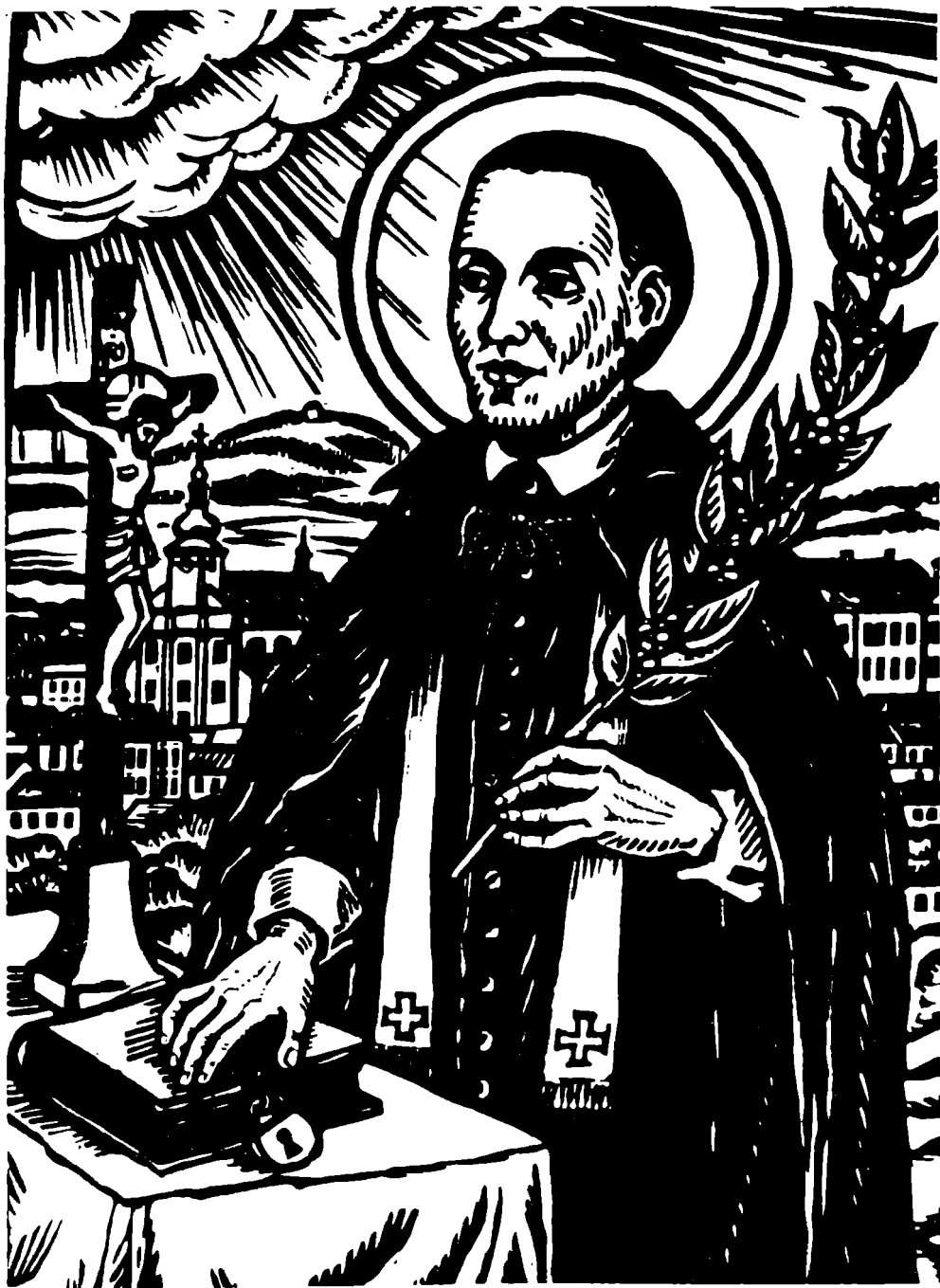
Blagostawiony Jan Sarkander ze Skoczowa (1576--1620).