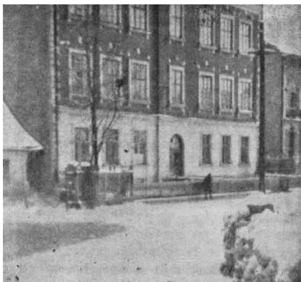
Fot. 3. Budynek szkoły fundacji barona Maurycego Hirscha 15

Przy szkole istniały również pracownie rzemieślnicze, gdyż fundacja barona M. Hirscha miała także na celu kształcenie zawodowe. Od roku 1899 w budynku mieściła się też szkoła handlowa dla dziewcząt, w której uczyły się one szycia. Ponadto szkoła przede wszystkim kształciła dziewczęta jako dobre gospodynie domowe, które winny umieć również gotować, prać, prasować, szyc, czytać, pisać i liczyć.