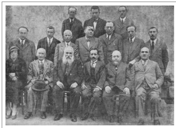
The managing committee members of Safa Berura in 1933

języka hebrajskiego i literatury oraz religii. W programie wychowania występowały również akcenty wychowania obywatelskiego, w ramach którego zapoznawano uczniów z polską tradycją narodową.