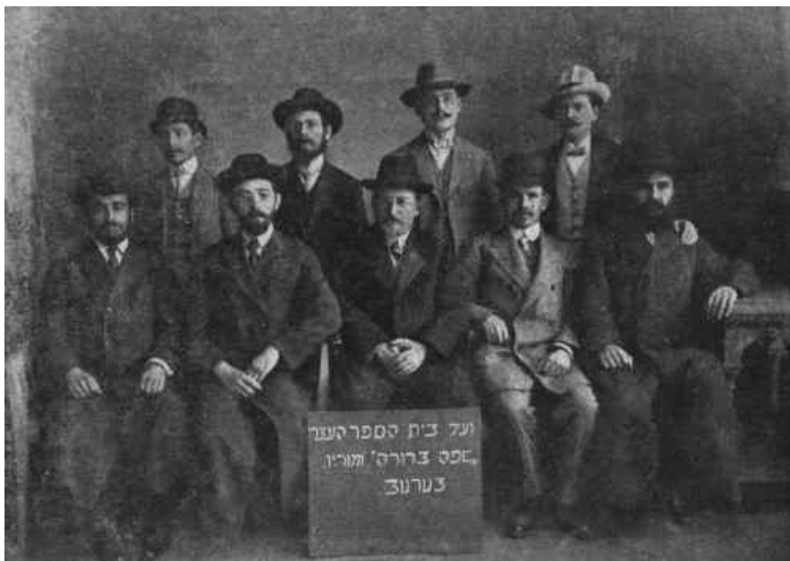
Fot. 6. Pierwszy komitet Towarzystwa „Safa Berura” w Tarnowie 29

Zostały utworzone dwie szkoły, najpierw Prywatne Gimnazjum i Liceum Koedukacyjne Towarzystwa Żydowskiej Szkoły Powszechnej i Średniej „Safa Berura”, a później Prywatne Gimnazjum Koedukacyjne Stowarzyszenia Żydowskiego Nauczycieli Szkół Powszechnych i Średnich.