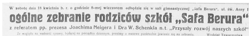
Fot. 13. Informacja prasowa o zebraniu rodziców uczniów uczęszczających do szkół „Safa Berura” w Tarnowie 61

W roku szkolnym 1936/37 do 4-klasowego gimnazjum nowego ustroju i klas VII-VIII gimnazjum dawnego typu uczęszczało 221 młodzieży, w tym 128 chłopców i 93 dziewczęta, przekraczając nawet w klasach II bez uzasadnienia przepisową normę uczniów 60 .