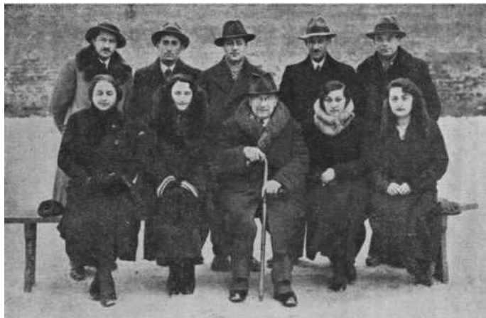
Fot. 9. Nauczyciele z gimnazjum „Safa Berura” w Tarnobrzegu w 1935 roku 41

Kadra nauczycielska miała w zasadzie pełne kwalifikacje pedagogiczne. W roku szkolnym 1936/1937 w gimnazjum „Safa Berura” pracowano 13 nauczycieli, w tym 8 mężczyzn i 5 kobiet 40 . Pełnych kwalifikacji nie mieli tylko nauczyciele uczący ćwiczeń cielesnych i zajęć praktycznych.