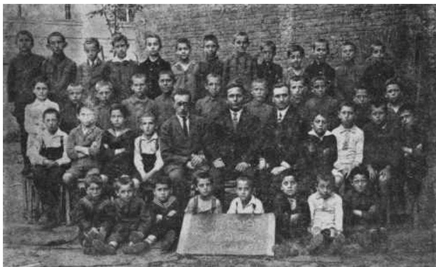
Fot. 5. Uczniowie szkoły powszechnej „Safa Berura”, początek lat dwudziestych 28

W okresie drugiej Rzeczypospolitej tarnowska młodzież żydowska wyznania mojżeszowego mogła pobierać naukę w państwowych szkołach średnich, jednakże