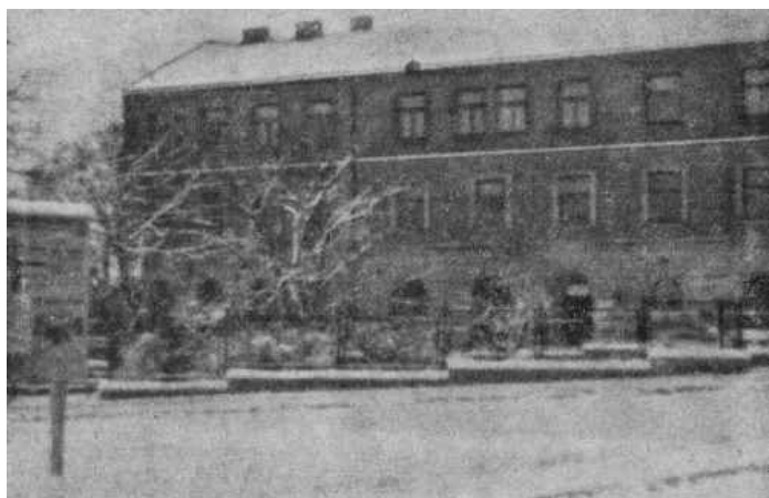
Fot. 7-8. Budynek szkoły powszechnej i gimnazjum hebrajskiego „Safa Berura” w Tarnobrzegu przy ul. Św. Anny 34