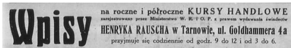
Fot. 14. Zapisy na kursy handlowe do szkoły Henryka Rauscha 65

W zakresie przysposobienia zawodowego działała w Tarnowie Jednoroczna Szkoła Przysposobienia Kupieckiego przedsiębiorcy izraelskiego Henryka Rauscha. W latach 1900/1901-1913/1914 funkcjonowała ona jako dzienna dwuklasowa szkoła handlowa prowadząca również kursy jednoroczne 64 .