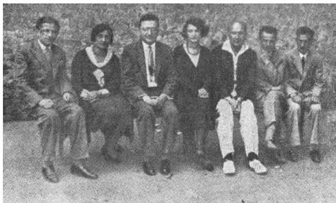
Fot. 10. Grupa nauczycieli szkoły średniej „Safa Berura” 42