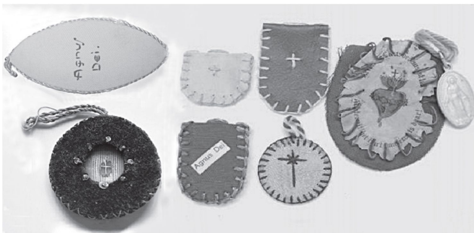
12. Różne formy tekstylnych pakiecików z partykułami Agnus Dei , 1. poł. XX w.