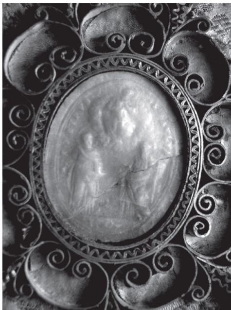
3. Agnusek Klemensa XI z 1707 r. (rewers), Łąd nad Wartą, tablica relikwiarzowa 1. tercja XVIII w.