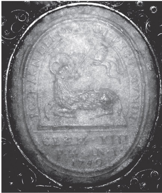
2. Agnusek Klemensa XIII z 1759 r. (awers), kościół SS. Wizytek w Warszawie, predella bocznego ołtarza.