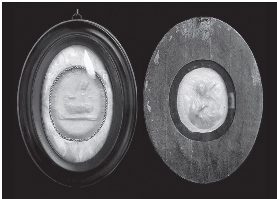
11. Agnus Dei Piusa XI z 1922 r. w ramiarskiej oprawie, kolekcja prywatna.