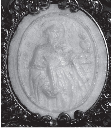
5. Agnusek z wizerunkiem św. Augustyna na rewersie, kościół SS. Wizytek w Warszawie, predella bocznego ołtarza św. Alojzego Gonzagi.