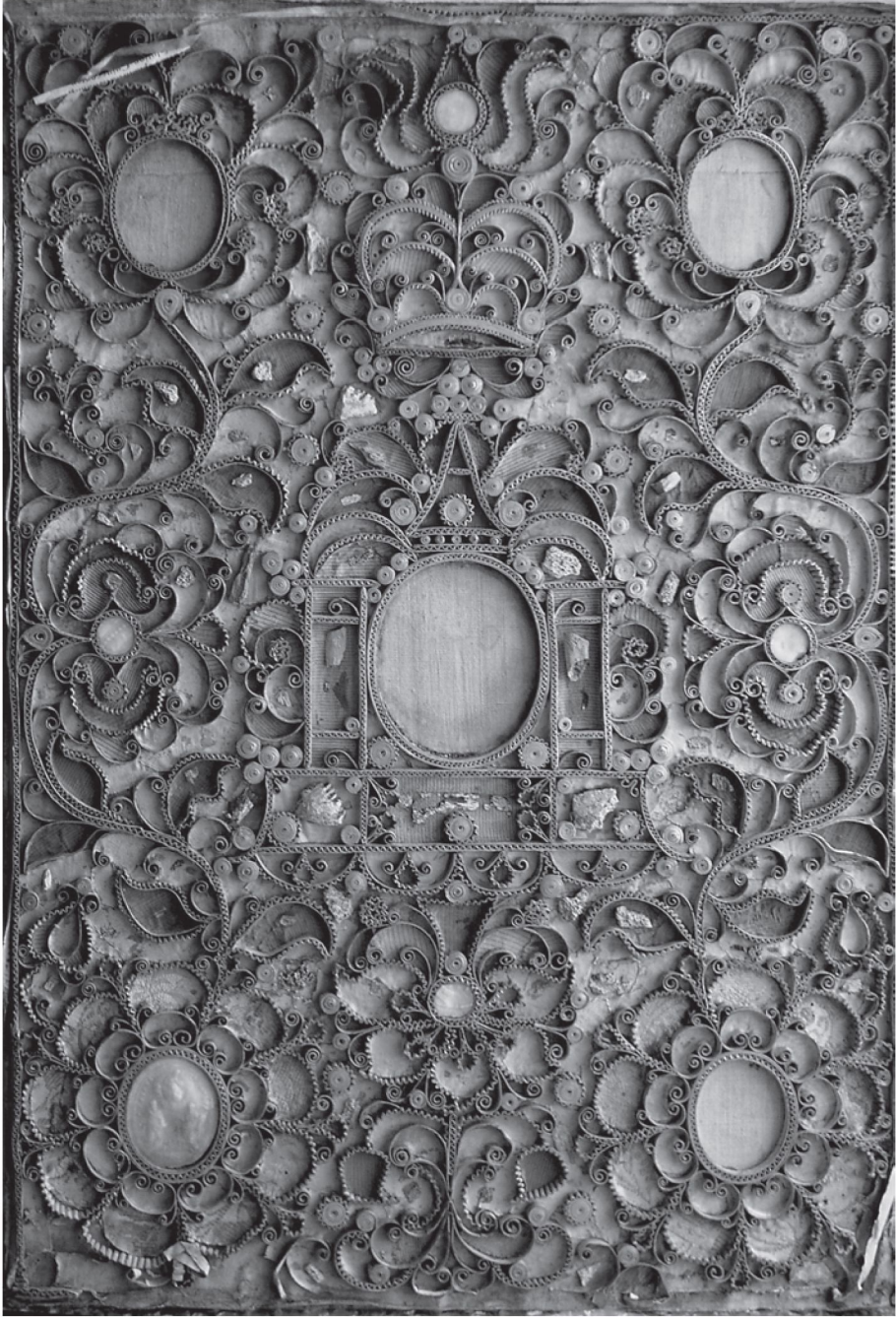
9. Tablica relikwiarzowa z zachowanym Agnus Dei Klemansa XI, 1. tercja XVIII w., Łąd nad Wartą, Biblioteka Wyższego Seminarium Duchownego.