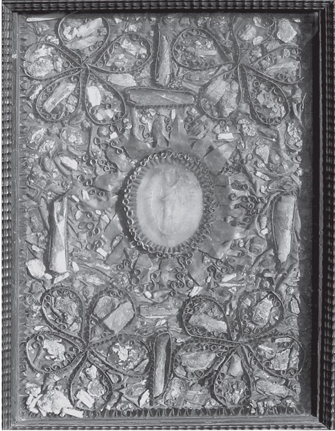
8. Tablica relikwiarzowa z Agnus Dei Innocentego X, poł. XVII w., Czerwińsk nad Wisłą Bazylika Zwiastowania NMP.