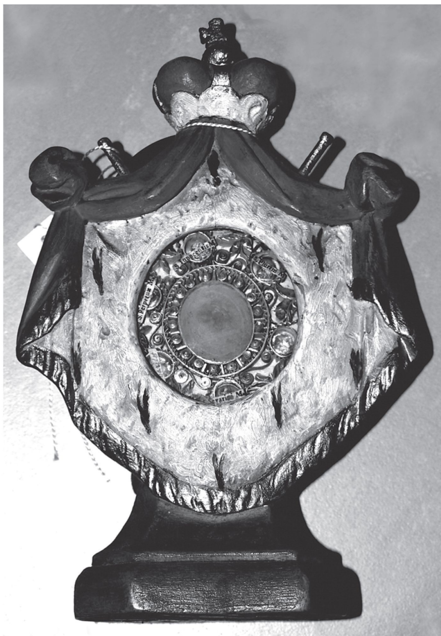
7. Pacyfikał z Agnuskim i relikwiami – tzw. „Relikwiarz Sanguszków”, 1732 r., Muzeum Prowincji OO. Kapucynów w Zakroczymiu.