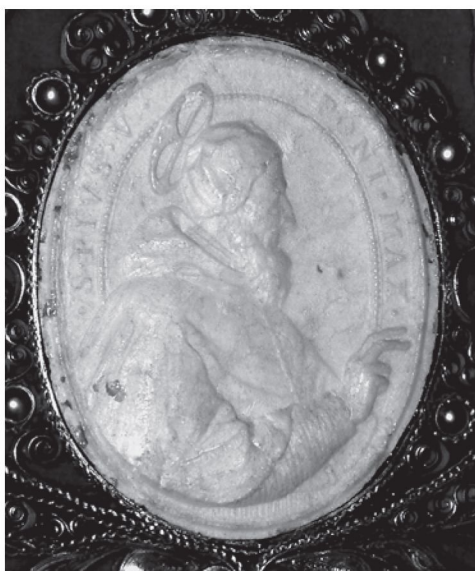
4. Agnusek Klemensa XI z 1714 r. (rewers z wizerunkiem św. Piusa V), kościół SS. Wizytek w Warszawie, predella bocznego ołtarza św. Alojzego Gonzagi.