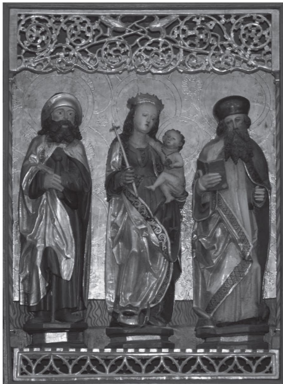
Fot. 5. Retabulum, Łubowo, kościół parafialny pw. Wniebowzięcia NMP, część centralna

Łubowski ołtarz, często nazywany również w literaturze przedmiotu starowickim, zachowuje bardzo rozpowszechniony układ z okresu późnego średniowiecza z trzema dużymi figurami w scenie centralnej w typie Sacra Conversatione , w centrum której jest Madonna z Dzieciątkiem i podwójnymi kwaterami w skrzydłach bocznych z grupami świętych.