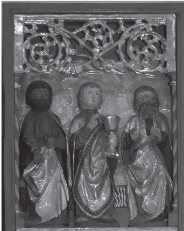
Fot. 7. Retabulum, Łubowo, kościół parafialny pw. Wniebowzięcia NMP, skrzydło prawe, kwaterna górna

Drugą grupę rzeźb stanowią figury umieszczone w prawej górnej kwaterze. Są to dwaj niezidentyfikowani święci, najprawdopodobniej apostołowie, pozbawieni jakichkolwiek atrybutów. Rozdziela ich Jan Ewangelista przedstawiony jako młodzieniec trzymający w lewej dłoni kielich 22 .