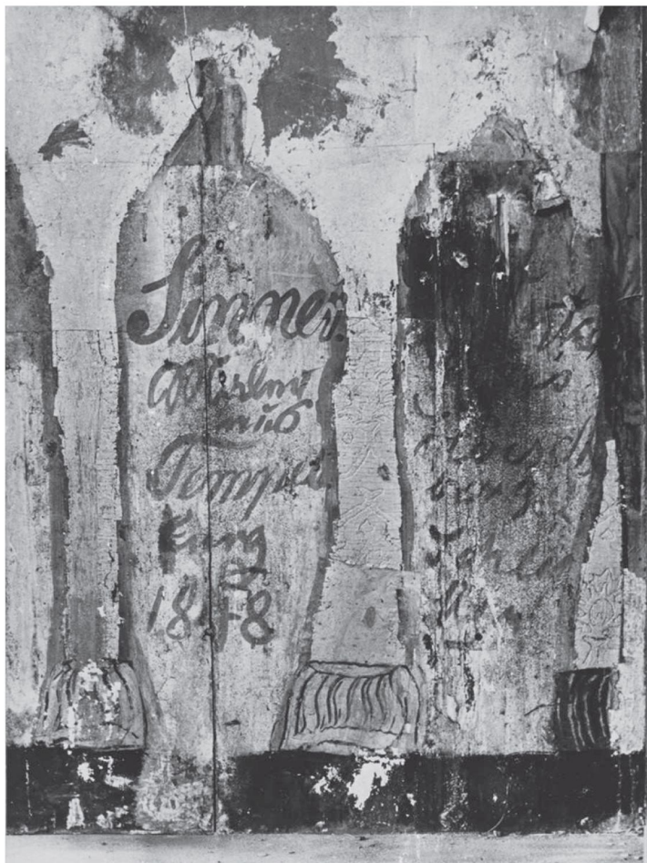
Fot. 2. Retabulum, Łubowo, kościół parafialny pw. Wniebowzięcia NMP, część środkowa szafy z napisami po wyjęciu figur