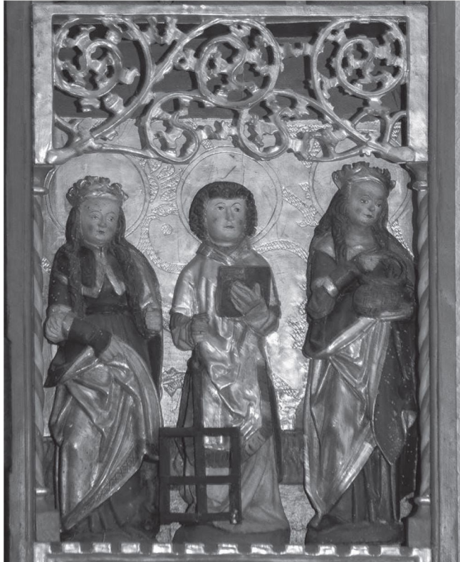
Fot. 9. Retabulum, Łubowo, kościół parafialny pw. Wniebowzięcia NMP, skrzydło prawe, kwaterna dolna [fot. Izabela Pańtak]

W prawej dolnej kwaterze cykl Świętych Dziewic kontynuuje święta Małgorzata ubrana w suknię z dużym kołnierzem czy pelerynką, okryta płaszczem, z koroną na głowie. W dłoniach brak atrybutu, zaś przy lewej nodze widoczny jest identyfikujący ją smok.