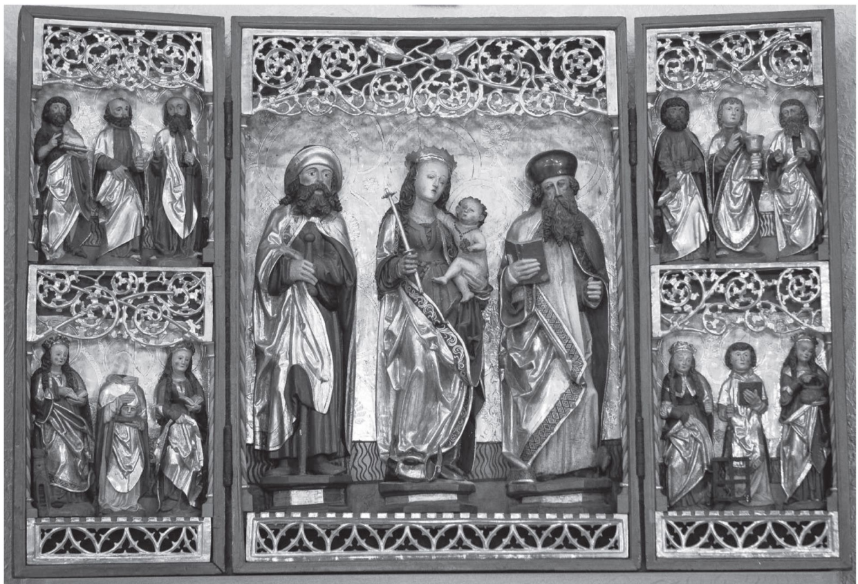
Fot. 1. Retabulum, Łubowo, kościół parafialny pw. Wniebowzięcia NMP

zwieńczona jest ażurowym maswerkowym baldachimem wspartym po bokach spiralnymi czerwono-zielonymi półkolumnkami. W dolnej części skrzydeł i sceny centralnej po blankowym ornamentie rozciągnięte zostały taśmy złotego roślinnego maswerku. W powstałych pod maswerkową osłoną niszach mogły być umieszczone pierwotnie relikwie świętych. W tle widoczna jest obecność złotej tkaniny z rytym ornamentem zakończonym malowaną frędzlą. Dokumentacja konserwatorska wymienia jeszcze krucyfiks. Całość dostępnej kompozycji datowana jest przez autorów opracowań inwentaryzacyjnych i konserwatorskich na około 1510 rok, jednak elementy kroju sukien Świętych Dziewic sugerują modę damską popularną na północy Europy w latach 1520–1530. Zdecydowanie poprawniejszą datacją byłoby wskazanie pierwszego ćwierćwiecza XVI wieku 4 .