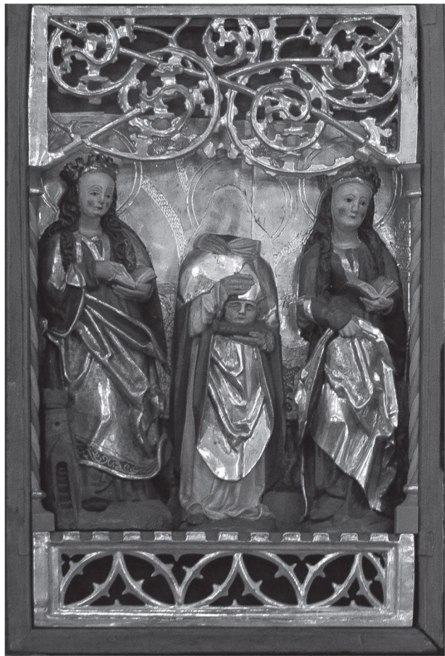
Fot. 8. Retabulum, Łubowo, kościół parafialny pw. Wniebowzięcia NMP, skrzydło lewe, kwarta dolna

Kierując uwagę ku dolnym kwarterom skrzydeł, napotykamy bardzo popularny w okresie gotyku zespół Czterech Świątych Dziewic, reprezentowany w lewej dolnej kwarterze przez świętą Barbarę i Katarzynę oraz towarzyszącego im świętego Dionizego biskupa.