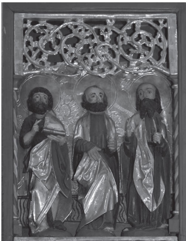
Fot. 6. Retabulum, Łubowo, kościół parafialny pw. Wniebowzięcia NMP, skrzydło lewe, kwaterna górna [fot. Izabela Pańtak]

Madonna ukazana jest w typie inspirowanym wizją Niewiasty obleczonej w słońce ( mulier solem amicta ), na co wskazuje obecność sierpu księżyca pod jej prawą obutą stopą. Ubrana w dworską suknię z narzuconym na ramiona złotym płaszczem, na głowie ma koronę, a w prawej dłoni trzyma berło. Na lewym przedramieniu podtrzymuje nagie Dzieciątko, które obejmuje prawą rączką szyję matki, zaś w lewej trzyma owoc. Na jego szyjce widoczny jest rodzaj naszyjnika – różańca złożonego z paciorków zakończonego krzyżykiem. Na lewo Madonnie towarzyszy święty Jakub Starszy, zwany niekiedy Pielgrzymem, ubrany w długą tunikę i płaszcz, w którego fałdach ukryta została pielgrzymia laska. Na głowie Jakub ma pielgrzymi kapelusz o szerokim wywiniętym rondzie 17 . Po prawej stronie Madonny i Dzieciątka stoi święty Antoni Opat trzymający w prawej dłoni otwartą księgę. Ma na sobie szaty zakonne i płaszcz, zaś na głowie kopulastą czapkę. Przy lewej obutej stopie świętego umieszczony jest niewielki dzik 18 . Wszystkie postacie usadowione zostały na wielobocznych postumentach.