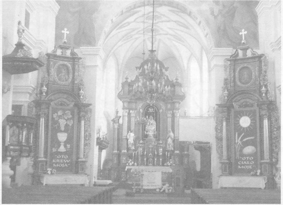
Fot. 4. Sztukaterie w prezbiterium dawnego kościoła augustianów w Lublinie