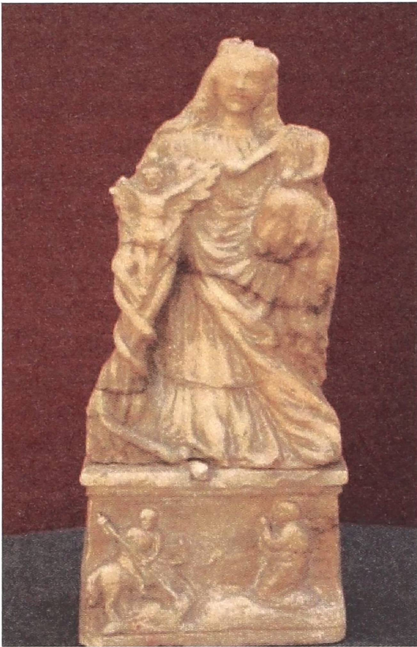
Jackowa Madonna Lwowska