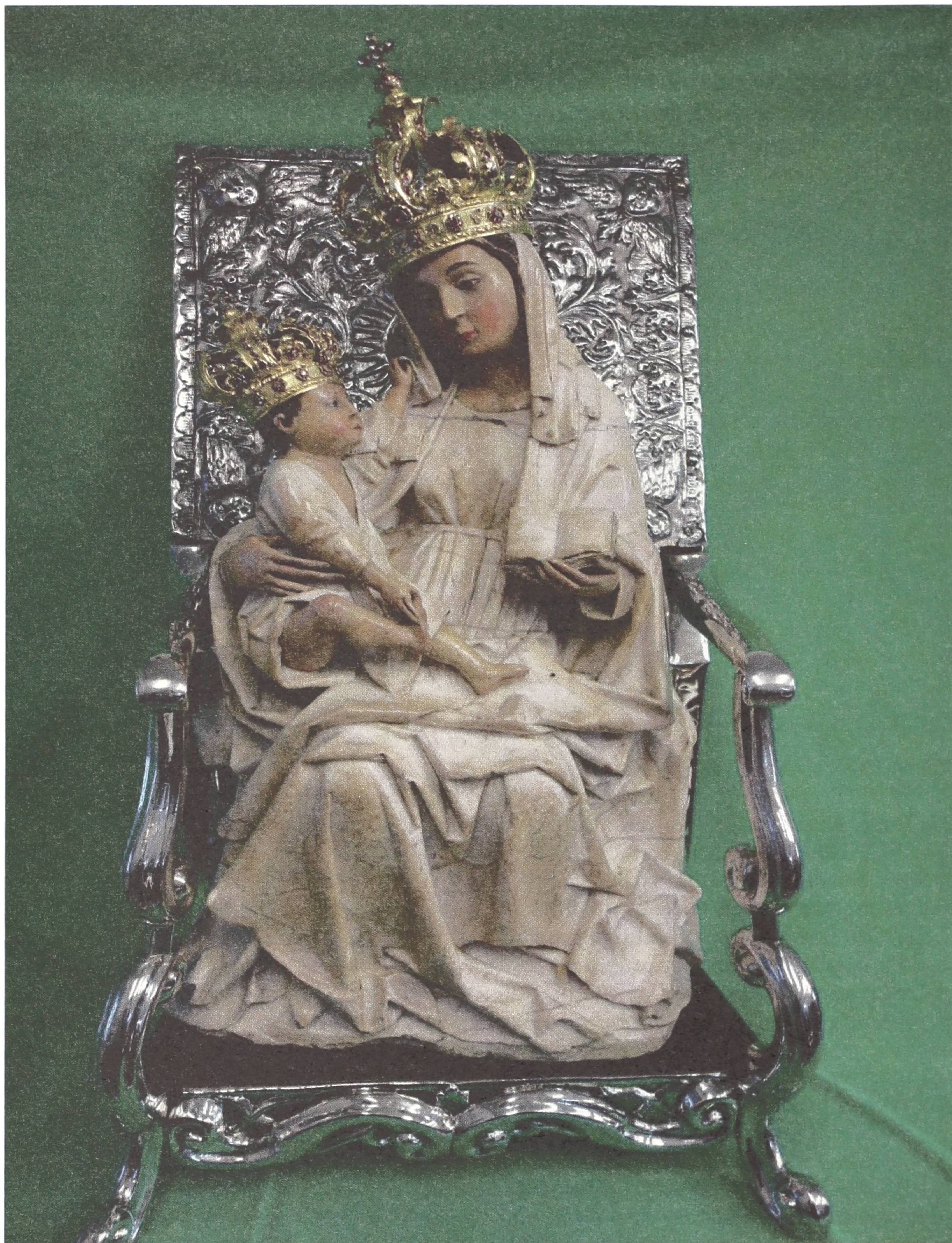
Przemyska figura Matki Bożej Jackowej po renowacji w 2016 r.