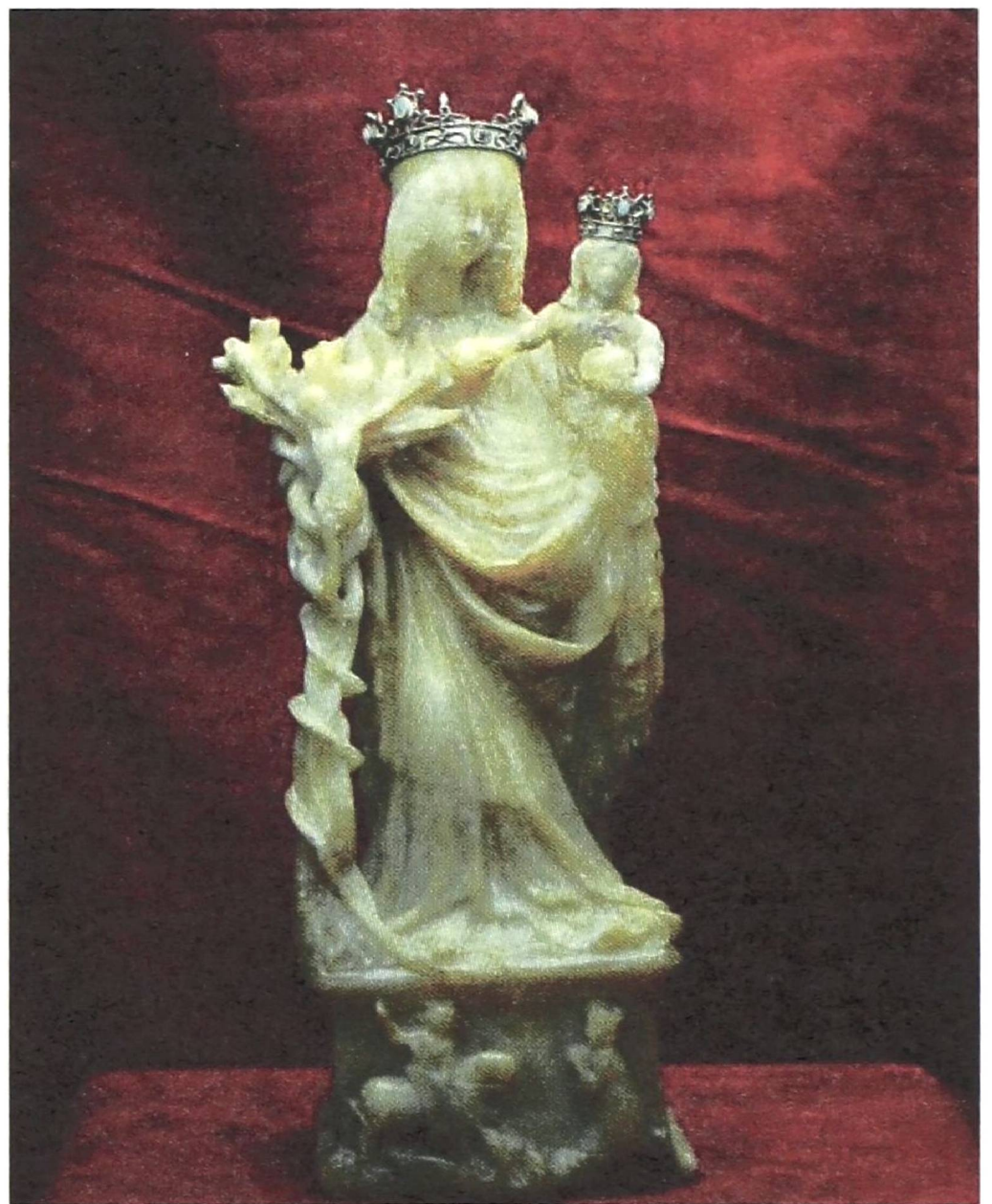
Jackowa Madonna Krakowska