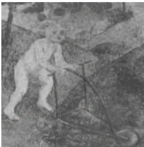
Ilustracja 20 a i b. Dzieci uczące się chodzić przy pomocy chodzika – Elbląska księga łąkowa 1421 (kopia ze zbiorów Muzeum Archeologiczno-Historycznego w Elblągu oraz fragm. sceny „Niewiniątkach w raju”, krużganki przy kościele augustianów w Krakowie ( Malarstwo gotyckie w Polsce , t. III, Album ilustracji, red. A.S. Labuda, K. Secomska, Warszawa 2004, il. 151).

I jeszcze jedno bardzo interesujące przedstawienie, również rzadko w ikonografii z naszych ziem, małe dziecko uczące się chodzić przy pomocy chodzika.