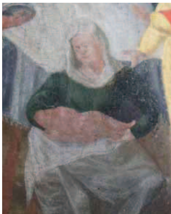
Ilustracja 7. Białogłowa, zapewne położnica z nowo narodzonym dzieckiem na rękach – fragm. Narodziny Marii, Pułtusk