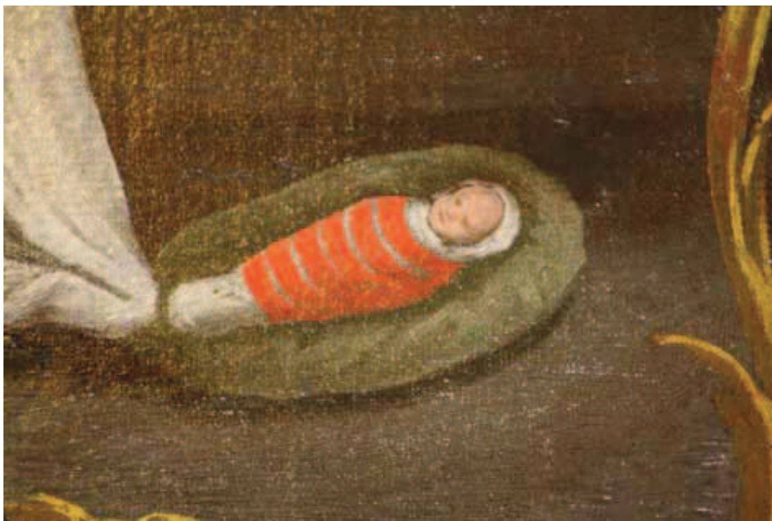
Ilustracja 1. Dziecko w powijakach – fragm. obrazu wotywnego z klasztoru bernardynów w Rzeszowie (ilustracje pochodzą ze zbiorów autorki)

z innymi przekazami źródłowymi – pisanymi, ukazującymi nie teoretyczne zapatrywania jak powinno być, ale te pokazujące jak faktycznie było, oraz materialnymi i ikonograficznymi.