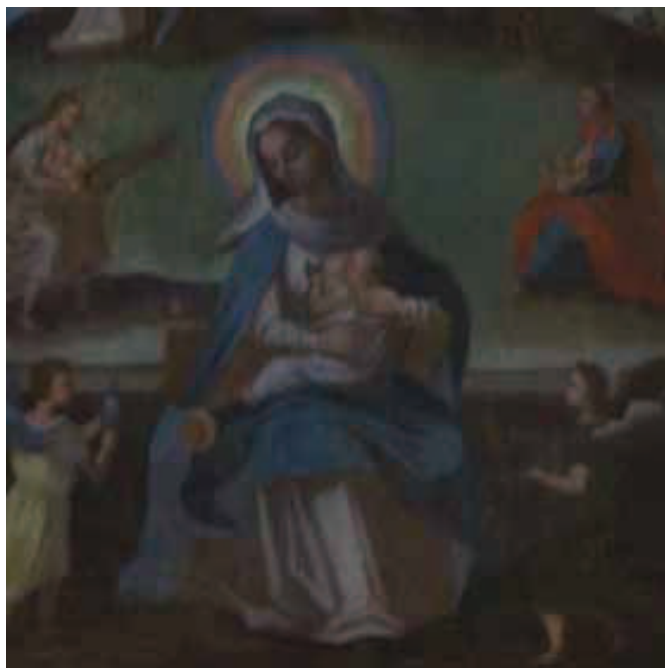
Ilustracja 5. Matka Boska Karmiąca – Kalwaria Zebrzydowska