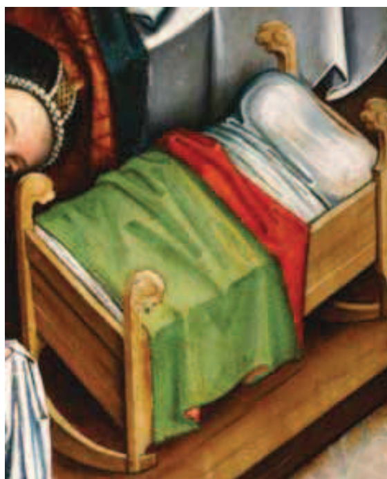
Ilustracja 15. Kołyska z płozami – fragm. polptyku z Olkusza