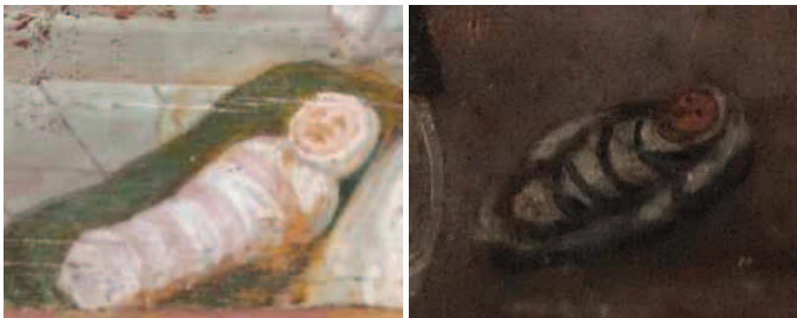
Ilustracja 4 a i b. Dzieci w powijkach – fragm. obrazów wotywnych z Pakości i Biłgoraja