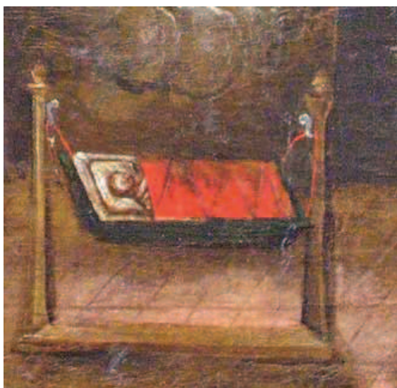
Ilustracja 18. Kołyska – fragm. obrazu wotywnego z Kościoła Bożego Ciała w Krakowie

narodzoną Marię. Wyraźnie widać w tym przypadku, że na dnie kołyski położona jest biała pościel. Wyobrażona na tym obrazie kołyska ma wycięty wzór na jednej ze ścianek, a pewno i symetrycznie na drugiej również. Podobne zdobienia widać na bocznych ściankach.