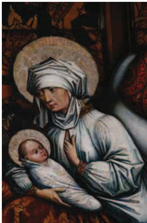
Ilustracja 6. Położnica z noworodkiem – fragm. poliptyku olkuskiego

Wśród tego typu wyobrażeń wymienić można pochodzącą z końca XV w. z kościoła w Olkuszu scenę z tzw. poliptyku olkuskiego namalowaną przez znanego krakowskiego