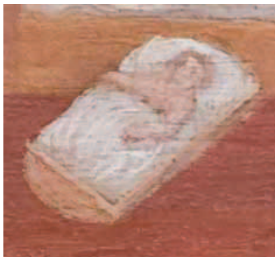
Ilustracja 14 a i b. Kołyski bez płóz – fragm. Wielka Rodzina ze Stobiecka oraz obraz wotywny z Gidl