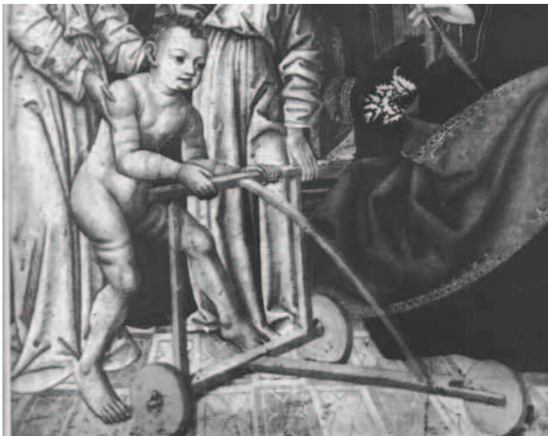
Ilustracja 21. Jezus uczący się chodzić – Wrocław (M. Otto-Michałowska, Gotyckie malarstwo tablicowe w Polsce, Warszawa 1982, il.20)

Opis takiego chodzika widzimy u Jędrzeja Kitowicza – „wsadzano go w wózek okrągły, pod pachy dziecięcia wysoki, mający u spodu cztery kółka, na wszystkie strony obrotne, aby się mógł posuwać wszędzie, gdziekolwiek dziecię, nogami na ziemi stojące, iść chciało” 41 . Chodziki widzimy także na bordiurze elbląskiej księgi łąkowej z 1421 roku. Inne znane przedstawienie dziecka z chodzikiem to scena „Niewiniątka w raju” namalowana w krużgankach przy kościele augustianów eremitów w Krakowie z początku XVI w. Polskie czy lepiej staropolskie chodziki mają trzy koła i specyficzną konstrukcję, dziecko nie było wkładane do chodzika, tylko trzymało go przed sobą i pchając poruszało się, przede wszystkim do przodu. U Kitowicza jednak czytamy o takim chodziku, jaki spotykamy na ilustracjach pochodzących z innych terenów. Niestety z powodu niewielkiej ilości materiału źródłowego trudno stwierdzić czy faktycznie występowały na naszych terenach takie trzykołowe chodziki, a Kitowicz opisywał „obce” wzory, czyli nie można mówić o żadnych typach chodzików charakterystycznych dla naszych ziem.