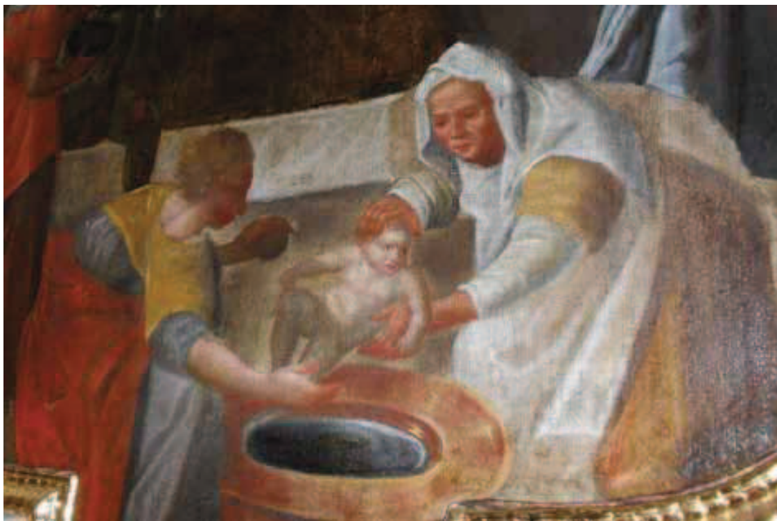
Ilustracja 10. Kąpiel noworodka – fragm. Narodziny Marii ze Skalbmierza

jej wiek świadczy o doświadczeniu i upoważnia ją do odgrywania ważnej roli w tym, co się dzieje – w przyjmowaniu nowego życia. Pozostałe niewiasty pomagają lub przyglądają się jej czynnościom.