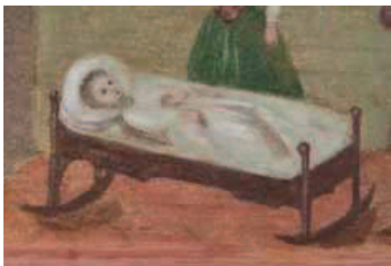
Ilustracja 17. Kołyska z płozami – fragm. obraz wotywny z Gidl