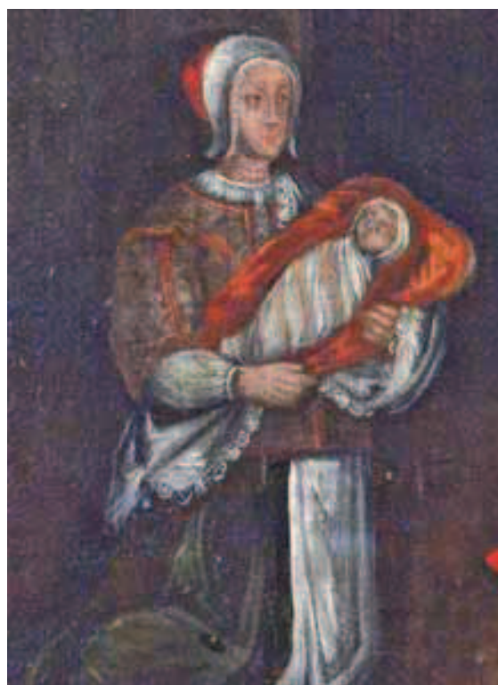
Ilustracja 9 a i b. Matka z dzieckiem – fragm. Wielkiej Rodziny z Szydłowca oraz piastunka z dzieckiem – fragm. obrazu wotywnego z kościoła Bożego Ciała w Krakowie