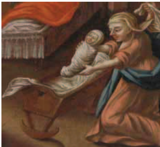
Ilustracja 16. Kołyska z płozami – fragm. Narodziny Marii, Kalwaria Zebrzydowska