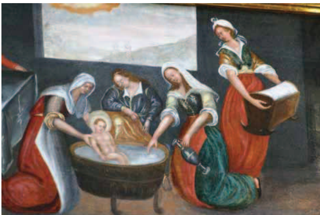
Ilustracja 12. Kąpiel noworodka – fragm. Narodziny Marii, Przysietnica