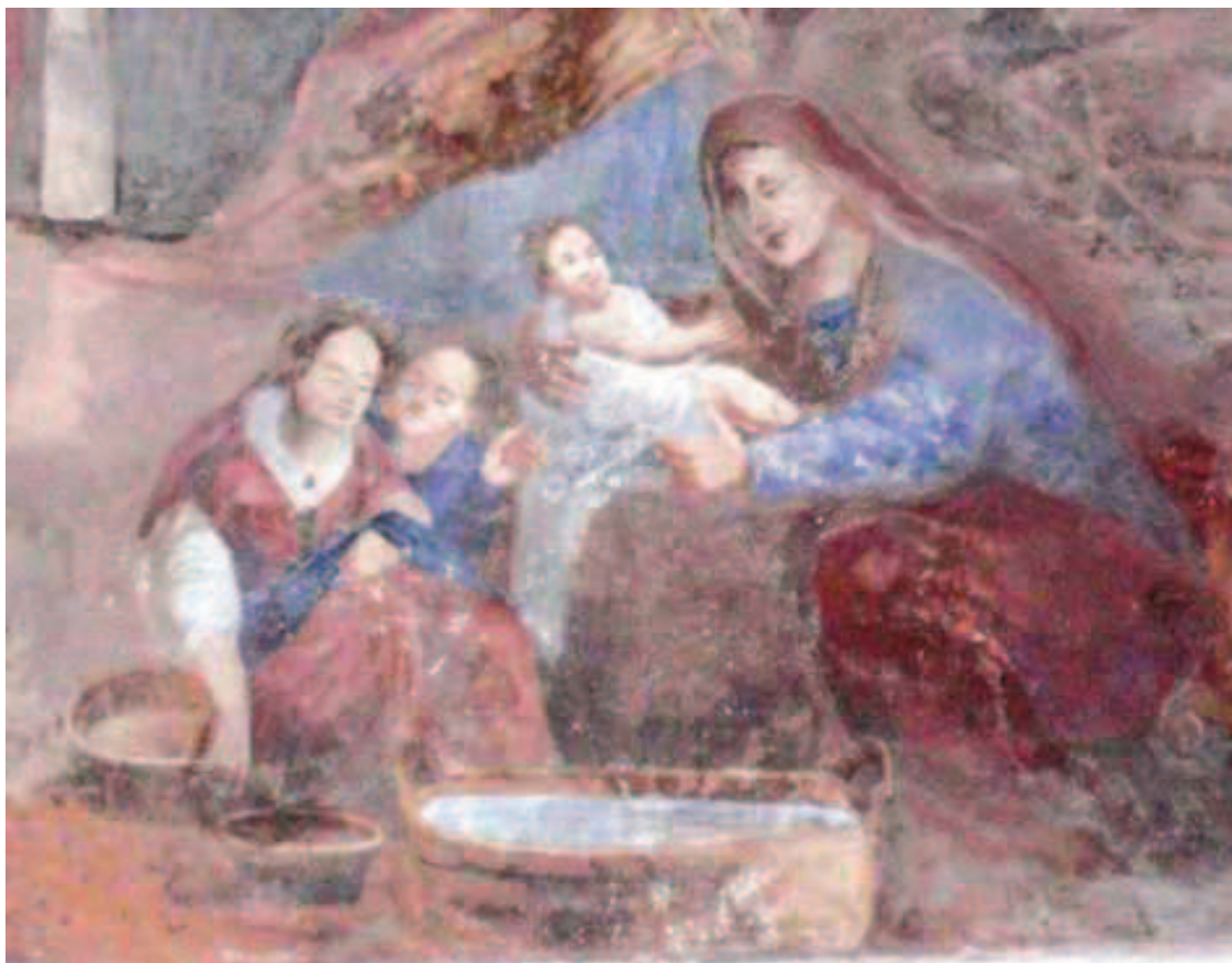
Ilustracja 11. Kąpiel noworodka – fragm. Narodziny Marii, Tarłów