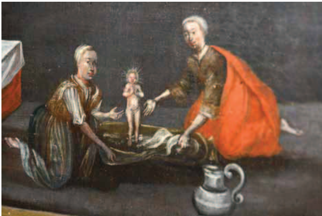
Ilustracja 13. Kąpiel noworodka – fragm. Narodziny Marii, Targowiska