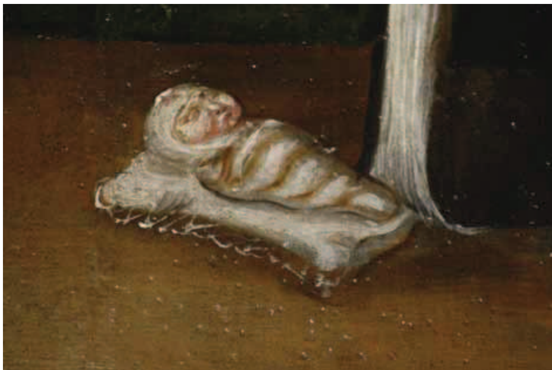
Ilustracja 3. Dziecko w powijkach – fragm. obrazu epitafijnego z kościoła ewangelickiego w Byczynie

Wyobrażenia dzieci w powijkach spotykamy w różnego rodzaju przedstawieniach od czasów średniowiecza do wieku XIX 28 . Na ziemiach polskich motyw ten występuje od początków XIII stulecia, początkowo głównie w ikonografii Bożego Narodzenia. Następnie pojawiają się i upowszechniają przedstawienia sceny narodzin, przede wszystkim Marii i na nich również widzimy dziecko w powijkach. W scenie narodzin Marii nowo narodzona niekiedy została już szczelnie powinięta (Olkusz), w przedstawieniu Rodziny Marii, a szczególnie Wielkiej Rodziny występuje również motyw niemowlęcia w powijkach (Szydłowiec, kościół św. Zygmunta, Nowy Targ), na niektórych wyobrażeniach Matki Boskiej z Dzieciątkiem Jezus również jest powinięty (Moskorzew kościół św. Małgorzaty). Dzieci w powijkach widzimy w przedstawieniach epitafijnych – tam wśród sylwetek członków rodziny dostrzec można czasami również tych najmłodszych zawiniętych w powijaki.