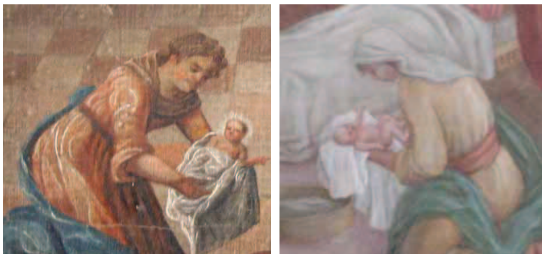
Ilustracja 8 a i b. Kobiety z dziećmi na rękach – fragm. sceny narodzin NMP z Pakości i Przemyśla

Z kolejnych stuleci mamy następne przedstawienia tej sceny, między innymi z Pakości, Górecka Kościelnego, Przysietnicy, Targowisk, czy Przemyśla, Jarosławia, Pułtuska i wiele innych. Widzimy na nich nowo narodzoną Marię na rękach prawdopodobnie położnej, a w każdym razie na rękach wyróżniającej się od innych strojem, wiekiem lub po prostu wielkością kobiety, która szykuje dziecko do kąpeli, ewentualnie właśnie kąpie.