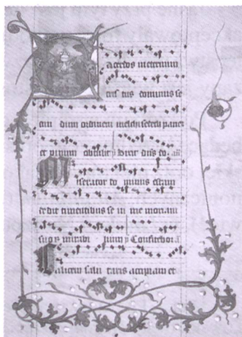
Fot. 2. Początek I Nieszporów oficjum o Bożym Ciele, rękopis EC lad. 4, Archiwum Miejskie, Bratysława