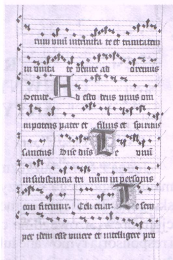
Fot. 1. Początek I Nokturnu oficjum o Trójcy Świętej, rękopis EC lad. 4, Archiwum Miejskie, Bratysława.

Pozornie wydawać by się mogło, że rozplanowanie ośmiu modi dla sześciu kompozycji nie przedstawia trudności. Wystarczy jednak przeanalizować inne przykłady, by zdać sobie sprawę z problemu, który stanowi kanwę artykułu. Oto antyfony Laudes tego samego oficjum: