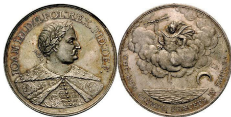
Il. 1. Johann Marten Schmelzinger (Smeltzing), Medal z okazji oswobodzenia cesarskiej stolicy, Wiednia – srebro bite, Leyda, 1683 : na awersie realistyczny portret królewski, na rewersie postać Jana III Sobieskiego identyfikowanego z gromowładnym Jowiszem ciskającym pęk piorunów w kierunku spadającego półksiężycza, emitowany z inicjatywy dysponenta królewskiego.

W czasach najbliższych Sobieskiemu nie sposób nie zatrzymać się dłużej nad jednym z najsłynniejszych konterfektów doby nowożytnej, który posiada wiele cech wspólnych z medalierskim wizerunkiem Jana III Sobieskiego i stanowi pośredni, lecz bardzo ważny, punkt odniesienia dla wielu późniejszych artystów – malarzy, rytowników, rzeźbiarzy – pracujących na ówczesnych dworach europejskich. Mowa w tym miejscu o dziele malarskim pędzla Charlesa Poersona 2 , który uwiecznił w 1655 roku na płótnie kilkunastoletniego Ludwika XIV (Paryż, Wersal,