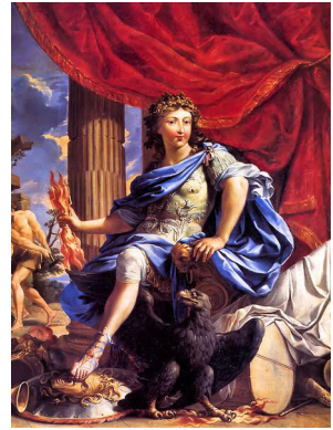
Il. 2. Charles Poerson, Reprezentacyjny konterfekt Ludwika XIV wykreowanego na Jowisza pokonującego Frondę , płótno, olej, Paryż, 1655, Wersal, Pałac Królewski ( Louis XIV, the Sun King 2017).

Pałac Królewski) (il. 2). Młody monarcha, nobilitowany podobnie jak Sobieski na wielu artefaktach medalierskich wieńcem laurowym zamiast korony, w prawej opuszczonej dłoni ściska wiązkę piorunów. Nieco odmienne, mimo zachowania wymogów antykizacji, pozostaje odzienie – w przypadku pracy Poersona oddane z należytą starannością. Można wyróżnić niebieski, szeroki płaszcz spięty broszą na prawym ramieniu, który znajduje swój dużo skromniejszy odpowiednik na drugiej stronie medalu Schmelzingera. Największą wartość przedstawia nieodłączna część ryszunku Ludwika XIV – antyczna zbroja płytowa, pięknie grawerowana, cyzelowana i zdobiona motywami roślinnymi. Do największych różnic należy natomiast zaliczyć, prócz wspomnianej scenografii, na którą w wypadku monarchy francuskiego składają się rzymskie ruiny i sporych rozmiarów czerwona kotara, zaaprobowane zapewne przez dysponenta ujęcie i położenie postaci. Gromowładny Sobieski znajduje się w pozycji stojącej, natomiast następcę tronu kraju nad Sekwaną – siedzącą na taborecie. Ciekawie również zadośćuczyniono potrzebie ukazania przewagi moralnej władcy. Tarcza z głową meduzy spoczywająca na ziemi pod stopą monarchy stanowić mogła przestrożę dla wszystkich sprzeciwiających się woli „Króla Słońce”. Stojący obok orzeł przypominał natomiast o przymiotach wyróżniających Ludwika XIV spośród innych panujących.