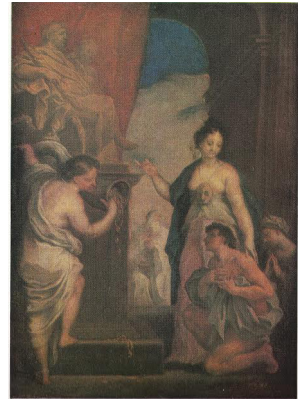
Il. 6. Jan Reisner, Gloryfikacja mecenatu artystycznego Jana III Sobieskiego , płótno, olej, po 1682 (reprodukcja, Chwała i sława Jana III 1983, 136, kat. Nr 18).

18) (il. 6). Fakt identyfikacji osoby Sobieskiego z Jowiszem znajduje potwierdzenie nie tyle w utrwaleniu panującego na podobieństwo starożytnych Rzymian (paludament i wieniec laurowy na głowie), co w ważnym atrybucie towarzyszącym modelowi. Wiązka piorunów, która od zawsze była uważana za symbol władzy i siły została umieszczona w ręku monarchy. Odmienne jest jednak przesłanie propagandowe dzieła. O ile na rewersie medalu autorstwa Schmelzingera Jowisz ciska piorunami w turecki półksiężyc utożsamiany z imperium osmańskim, o tyle na obrazie Reisnera stanowi uosobienie dobrotliwego i opiekuńczego władcy-mecenasa sprawującego osobistą opiekę nad artystą prowadzonym przed oblicze królewskie przez personifikację Imitatio.