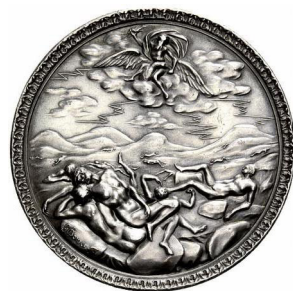
Il. 3. Georg Brower, Medal powstały z inicjatywy Karola II Stuarta pragnącego uświetnić w odpowiedni sposób restaurację monarchii angielskiej , srebro bite, Londyn, 1660; na rewersie ilustracja gromowładnego Jowisza ciskającego piorunami w Gigantów, emitowany z inicjatywy dysponenta królewskiego (władcy brytyjskiego).

Do tematyki mitologicznej nawiązano również na rewersie kolejnego z medali. Należy przypomnieć, iż wspomniane tu dzieło sztuki podnoszące rangę dokonania królewskich Karola XI powstało ok. 1677 roku w warsztacie Antona Meybuscha 4 (Przedmiot wystawiony na aukcji antykwariatu numizmatycznego „Fritz