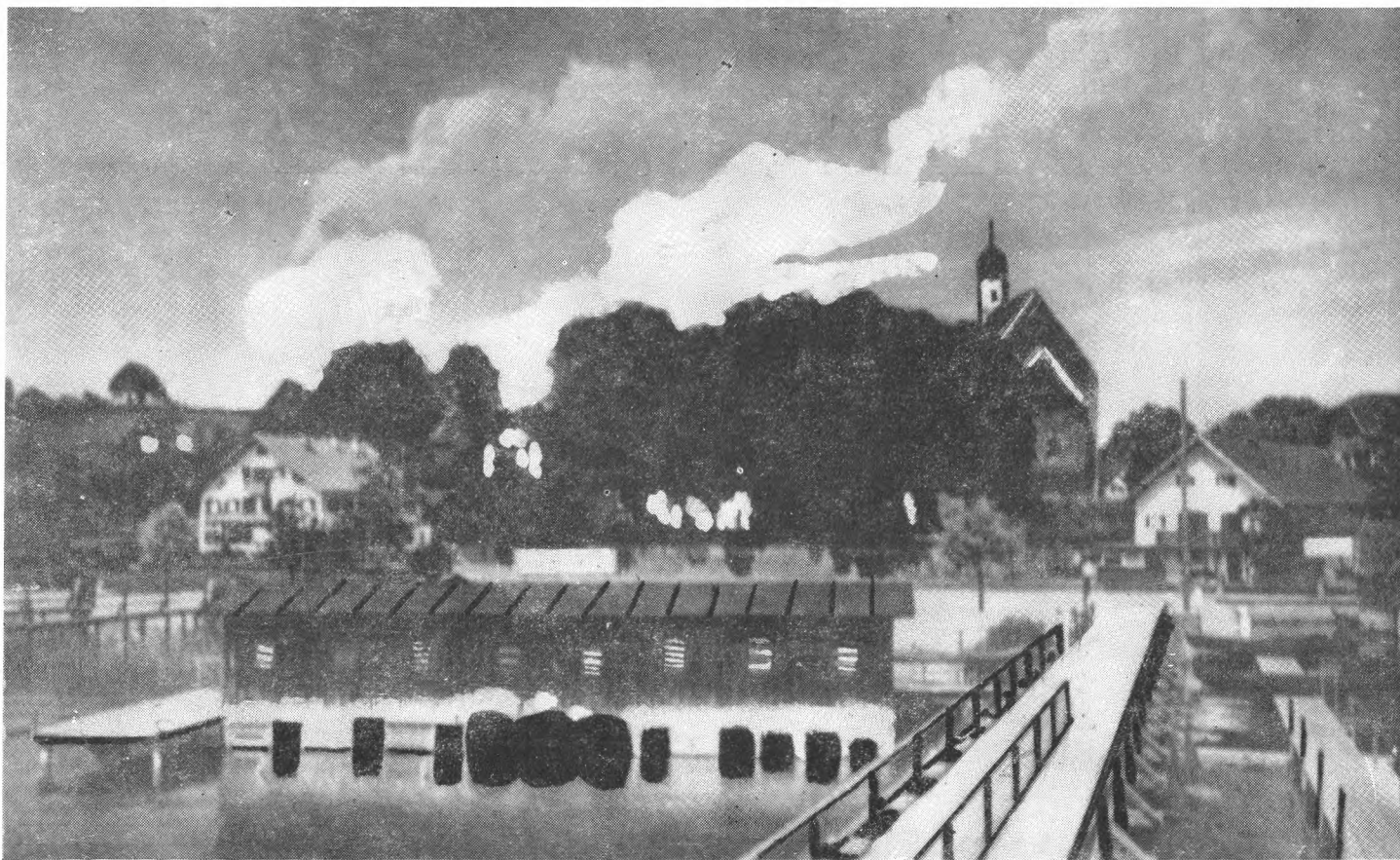
SCHONDORF AM AMMERSEE OK. R. 1940